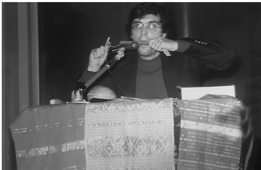
FIGURE 1 Gilles Tremblay lors de sa conférence «À l'écoute de l'Orient», donnée à l'Université de Montréal le 14 décembre 1972.

desquelles il a décrit les musiques qu'il avait entendues lors de son voyage, mettant l'accent sur celles de Corée, de Bali et de Java. La musique de Java semble l'avoir particulièrement marqué, puisque, dans la pièce qu'il compose à son retour de voyage, Oralléliuants , il évoque de manière explicite le gamelan javanais 16 . Ce renvoi à une musique extra-européenne peut paraître surprenant chez ce compositeur qui disait : « faire de l'exotisme musical ne m'a jamais attiré 17 ». Néanmoins, dans la notice d' Oralléliuants , Tremblay souligne sans équivoque l'influence de sa rencontre avec les cultures musicales asiatiques dans l'écriture de cette œuvre : « ... the work was written after my return from the Far East, and the influence this had was, I believe, by no means superficial, such as that acquired as a tourist or from a postcard or storybook 18 . »