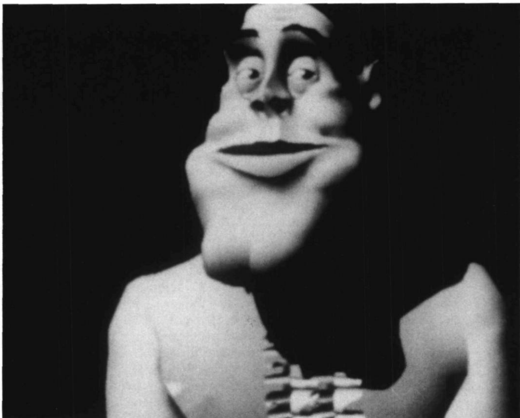
Tony de Peltrie de Philippe Bergeron, Pierre Lachapelle, Daniel Langlois, Pierre Robidoux (1985)

C'était un premier pas nécessaire. Il comporte bien des défauts. Tony est à la fois gauche et un peu trop parfait. Il n'a pas les imperfections des êtres vivants. Un détail: sa chemise lui colle à la peau... L'une des difficultés majeures de l'animation sur ordinateur est précisément de simuler ces imperfections, ces irrégularités du cheveu ou du vêtement qui sont celles des êtres humains 3 .