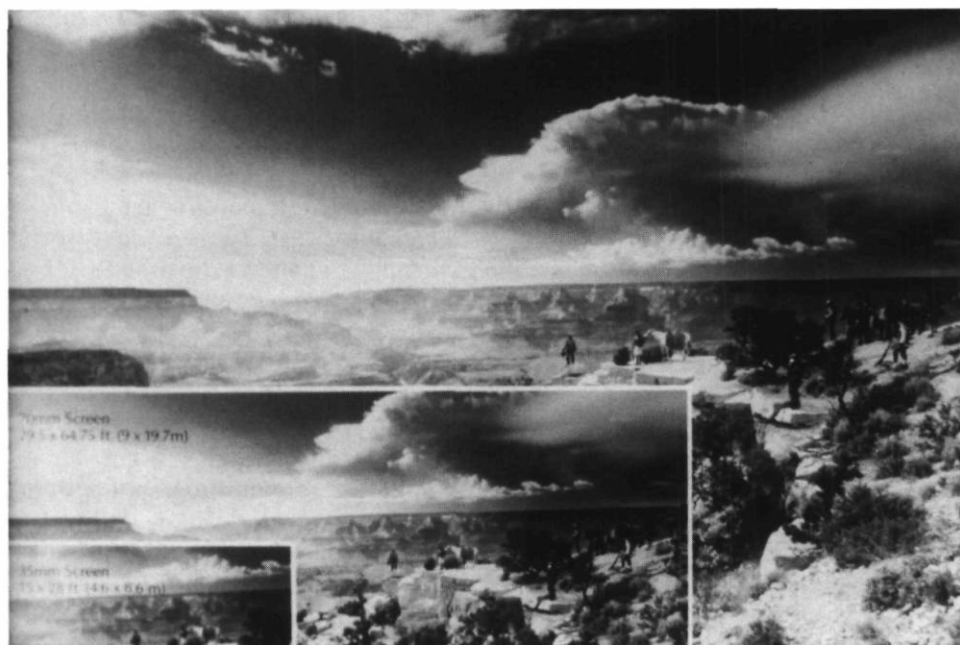
Comparaison entre les formats 35 mm, 70 mm et Imax