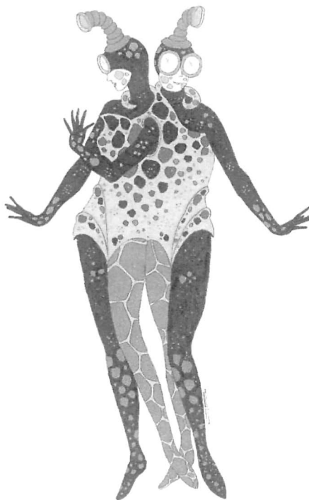
Les Siamois , projet de costume (lycra et latex), Crescent'O , Cirque d'Hiver, Paris, 1997.

On attribue généralement au costume de cirque traditionnel trois fonctions fondamentales : protéger le corps, préserver la pudeur ou la décence tout en conférant au corps de l'acrobate ou du dompteur une paradoxale acuité sensorielle, et assurer la parure. En outre, le costume possède une fonction de soutien technique et de valorisation physique poussée parfois à l'extrême par un jeu très efficace sur le dissimulé et le montré. La valorisation de la musculature de personnages athlétiques féminins ou masculins, en exacerbant radicalement les effets physiques de leur prestation, est constitutive de l'esthétique circassienne depuis le XIX e siècle. Cinq figures archétypales globalement définies entre 1770 et 1870 rassemblent dans leurs formes l'ensemble des directions esthétiques prises par les costumes de cirque. La formalisation de tous les autres systèmes d'affublement passe par le filtre esthétique de ceux-là : le maître de manège, le clown, l'écuyère, l'acrobate et le dompteur. De l'habit (1770) à la souquenille (1830), du tutu (1832) au léopard (1859) et au dolman (1866), toutes les futures digressions vestimentaires établies dans l'axe de définition d'un costume de cirque s'inspireront de ces cinq modèles fondamentaux, codés et largement reproduits.