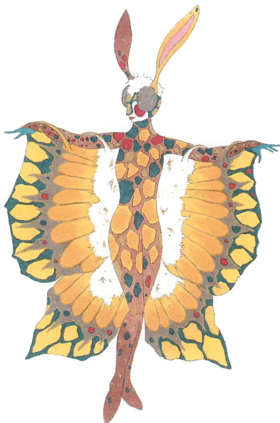
Le Papillon , projet de costume, Imagine , Cirque Phénix, février 2003.

partie d'un ensemble comprenant le corps, le jeu et la structure de l'espace. Le costume n'existe de toute façon qu'au travers de celui qui le porte. Entre l'acrobate, le clown ou l'écuyer, figures emblématiques du classicisme, et leur costume s'exprime une évidente relation instrumentale. L'artiste de cirque s'en sert pour opérer sa propre métamorphose. Et même si cette métamorphose est plus technique que comportementale, le costume, enveloppe et apparence, amorce cette conquête intime, et l'acrobate la parachève. Traiter d'un costume aussi singulier que celui du cirque revient donc à traiter du corps vêtu et de la manière dont il entrave ou, au contraire, permet de développer le jeu. Le costume de cirque, théâtralisé à sa façon, mineure sans doute dans la plupart des cas, est pourtant partie prenante d'une