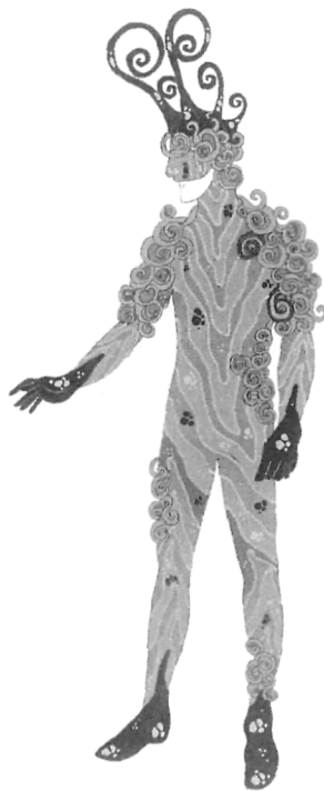
Le Patineur , projet de costume, Crescend'O , Cirque d'Hiver, Paris, 1997.

symbole. Comme si après deux siècles d'influences, de parenthèses et de références, la superficialité de l'apparence se muait en quête de vérité, comme si se produisait un extraordinaire glissement de sens et que, surgi il y a deux siècles de conceptions figuratives, le costume de cirque, par toutes ses échancrures, de tous ses plis, découvrirait avec avidité l'abstraction et la conceptualisation de ses formes. La chair longuement et soigneusement travaillée y gagne en transparence, et le cirque achève ainsi de lever une ambiguïté sur ses fonctions cathartiques. La chair y est crue. Le blafard n'effraie plus personne et la nudité revendiquée s'affirme comme un autre code. Elle souligne une autre sexualisation du corps de l'acrobate, de l'équilibriste ou du jongleur, moins explicite et plus cérébrale, et dans cette annexion du corps dévoilé s'exprime une forme de stylisation. Elle interroge et emblématise également une porosité des disciplines, et là où un siècle plus tôt personne ne se serait avisé de travailler dévêtu, répondent aujourd'hui autant de bouleversements esthétiques. Désormais, la forme humaine devient un élément-instrument scénique qu'il