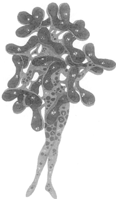
La Fontaine , projet de costume, Crescend'O , Cirque d'Hiver, Paris, 1997.

vision par trop intime de ces mêmes artistes où l'on verrait enfin saillir les imperfections de corps soumis : sueur et poils échappés, évacués par l'entrebâillement d'une chemise trop ample sur des chairs en mouvement. En action. Finalement, le cirque, au fur et à mesure de ses évolutions, mettrait-il davantage en avant un corps par ailleurs souvent refoulé ? Lorsque Léotard, le créateur du trapèze volant, se déshabille en 1859 pour s'élancer d'une barre de trapèze à l'autre, il attise le désir de ses contemporains et joue finalement sur un registre expressif plutôt trouble. (En 1861, lorsque Léotard se produira à Saint-Petersbourg, la censure impériale l'obligera à porter une chemise et une culotte noire, son maillot collant ayant été jugé indécent...). Il se dépouille aussi d'artifices inutiles et offre sa vitalité en contrepoint de la raideur des écuyers de son temps.