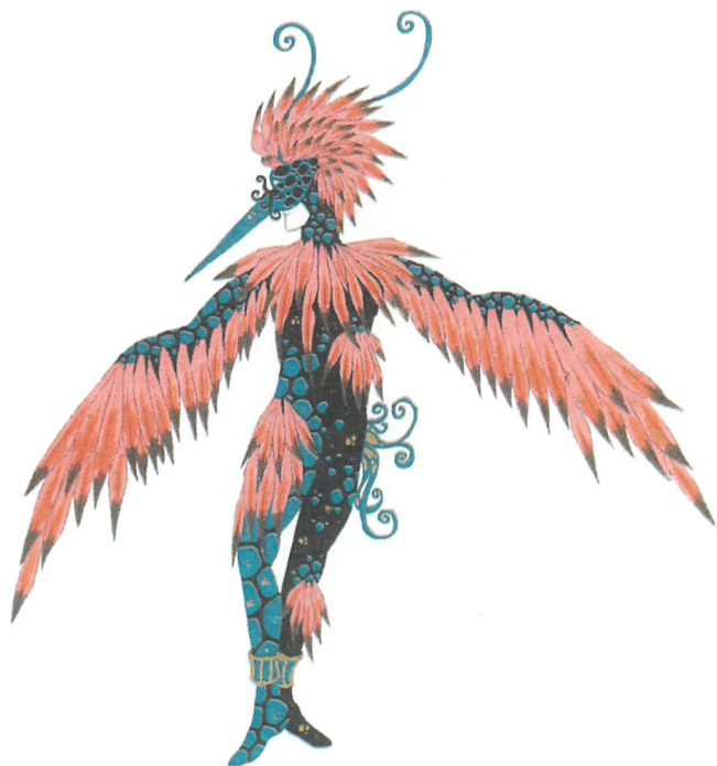
L'Homme-oiseau , projet de costume, Crescend'O , Cirque d'Hiver, Paris, 1997.

engouffre dans un mouvement perpétuel les énigmes du sens, sans pour autant tenter de les résoudre. Tout cela participe d'un subtil travail de rassemblement, de couture pour parler en termes de vestiaire, ou même, selon les cas, de rapiécage. Les fragments épars de la représentation sont tenus ensemble par de minces fils de sens, des intentions qui sont autant de liens. Elles sont les ligatures sensibles du destin et de la brusquerie du jeu : dévoilement, couleurs, chairs et os, tensions, équilibres, déséquilibres, corps et signes, costumes. De cirque.