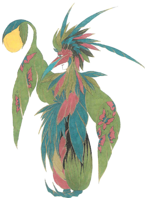
L'Éclaireur , projet de costume, Imagine , Cirque Phénix, février 2003.

Josef Nadj, sont-ils parfois trop rapidement qualifiés de « simples » parce qu'ils évoquent davantage qu'ils ne montrent, qu'ils évacuent toute trace de décorum, toute surcharge décorative qui viendrait parasiter l'unité de la vision proposée. Ils sont les éléments métaphoriques d'un monde extérieur, revêtus d'autres codes esthétiques que ceux du cirque, insérés dans le tissu spectaculaire. Suggérée comme une interface subversive à des prouesses bien réelles, leur présence souligne l'aspect volontaire de la juxtaposition des univers, affirme le dehors, spiritualise le jeu et annonce avec force la théâtralisation du corps et de son apparence. Quelques années plus tard, avec La tribu Iota , spectacle chorégraphié par Francesca Lattuada, émerge ce que l'on pourrait qualifier d'expérience baroque circassienne. Puisant sans cesse aux sources du cirque classique, les images composent un extraordinaire