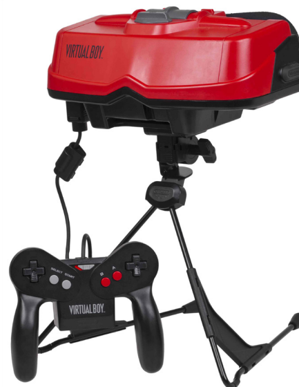
Set de la console Virtual Boy de Nintendo, composé d'un casque et d'une manette.

Au niveau des contrôles, le Virtual Boy possède une manette symétrique et plutôt ergonomique pour interagir avec ses mondes tridimensionnels. D'abord, on y retrouve l'emplacement pour les piles (qui peut aussi être équipé d'un adaptateur pour le brancher directement à une fiche murale), en plus de l'interrupteur pour démarrer la machine. Sur la face principale de la manette, on retrouve les désormais classiques boutons A , B , Start et Select et sur le verso, les boutons L et R , à utiliser avec les index. Une croix directionnelle se retrouve également de chaque côté de sa face principale pour permettre au joueur de mieux naviguer dans les univers en trois dimensions [4] .