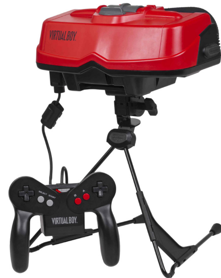
Nintendo Virtual Boy console set, made up of a headset and a controller. See database entry.

In terms of its controls, Virtual Boy had a symmetrical and fairly ergonomic controller for interacting with its three-dimensional worlds. First, there was a place for the batteries (it could also be equipped with an adapter for plugging the game directly into a wall outlet), in addition to a switch for starting up the machine. On the principal surface of the controller were the now-classic buttons A, B, Start and Select, and on the back the buttons L and R, to be used with the index fingers. There was also a directional pad on each side of its principal surface to enable the player to better navigate the game's three-dimensional world. [4]