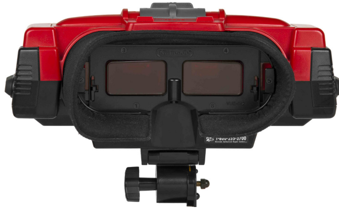
Écran de la console Virtual Boy de Nintendo. Voir la fiche .

Une autre déception relevée par Zachara et Zagal provient de l'expérience du Virtual Boy, qui est entièrement individuelle, isolant le joueur et rendant impossible le partage du jeu avec sa famille ou ses amis [11] . Un port pour connecter plusieurs consoles et jouer ensemble est présent; cependant, aucun jeu n'a pu profiter de cette option compte tenu de la durée de vie limitée de la console.