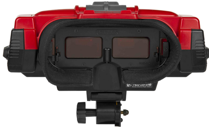
Screen of the Nintendo Virtual Boy console. See database entry.