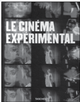
Le Cinéma expérimental Paul Young Paris : Taschen, 2009 192 pages