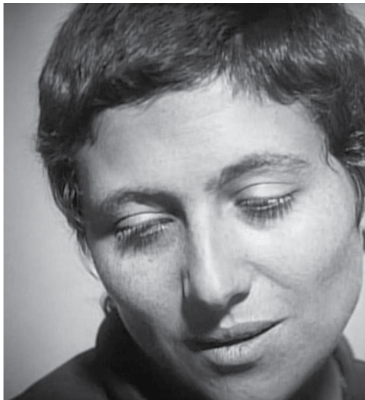
La Passion de Jeanne d'Arc de Carl Theodor Dreyer

l'arrière d'un tramway dans Rocco et ses frères ( Rocco e i suoi fratelli ) de Luchino Visconti où, derrière Alain Delon et Annie Girardot, le décor urbain que l'on quitte se laisse embrasser du regard. Ces deux formules visuelles reviennent souvent dans la série, le phantom ride pour entrer dans un pays sur les rails ou passer d'un pays à un autre de manière rapide et le plan pris d'un véhicule automobile souvent par la fenêtre ou dans un cadre plus restreint dans une rue bondée ou vide montrant la vie de Dakar, de Delhi ou d'ailleurs.