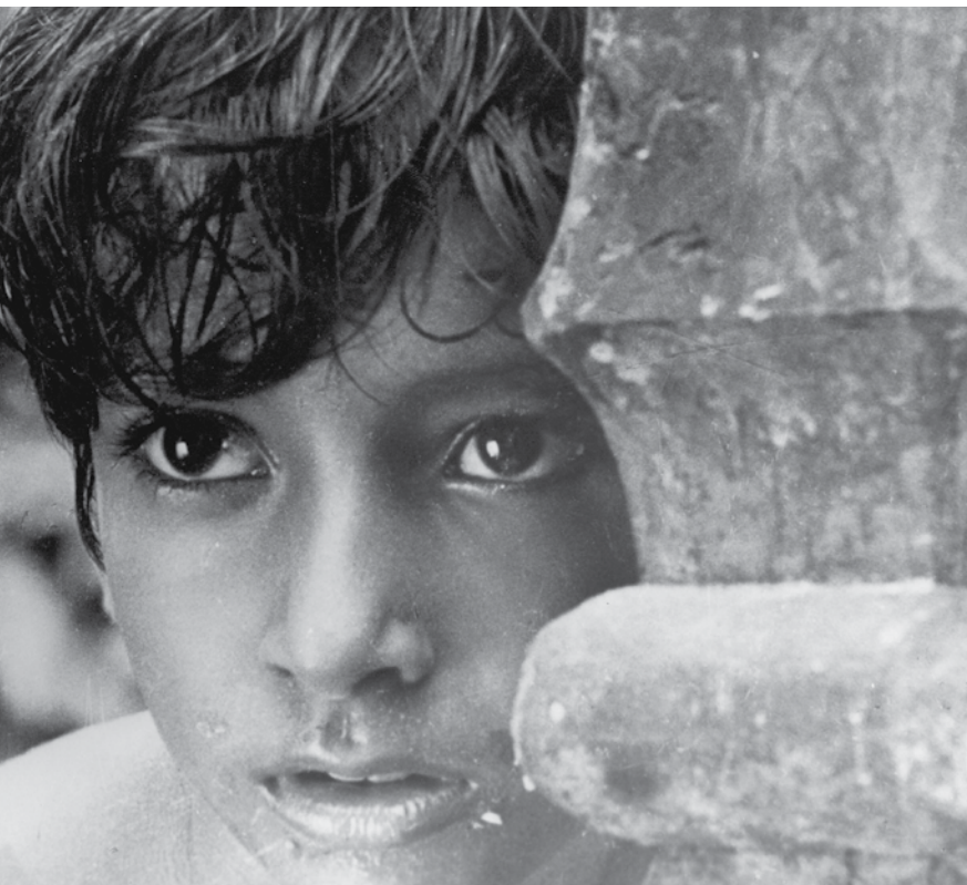
Panther Panchali de Satyajit Ray