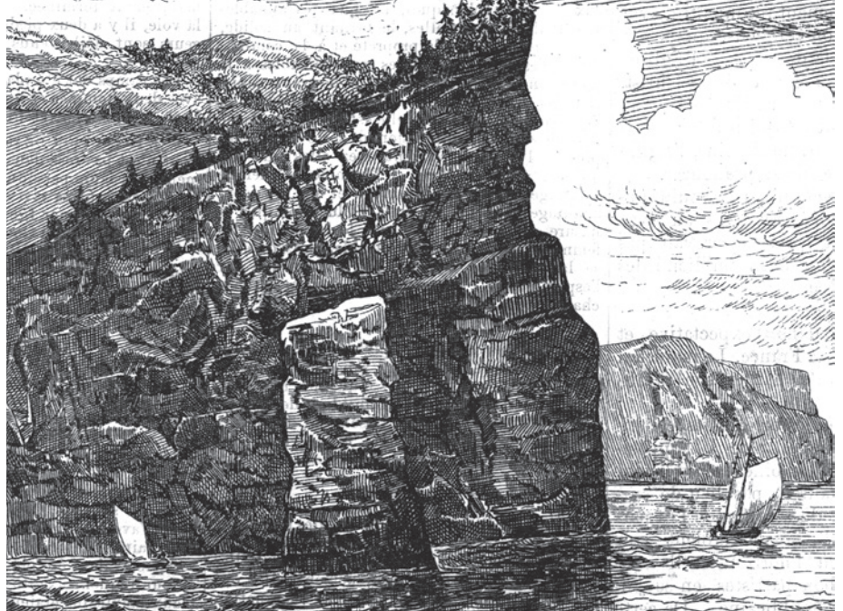
Wenmajojoney Gwesewei ou Pointe Souffrance (Cap Gaspé) épouse la forme d'une vieille Indienne malade.

Source : Pacifique De Valigny, Chroniques des plus anciennes églises de l'Acadie . Montréal, L'Écho de Saint-François, 1944. p. XIII.