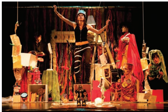
Éclats et autres libertés.