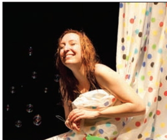
Les Zurbains 2011 : Dissection.