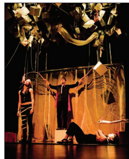
Éclats et autres libertés.