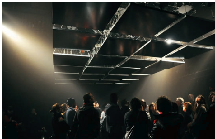
1 Roger Bernat, Le sacre du printemps, Mois Multi 13 , Québec, 2012. Photo : BLEND.A.