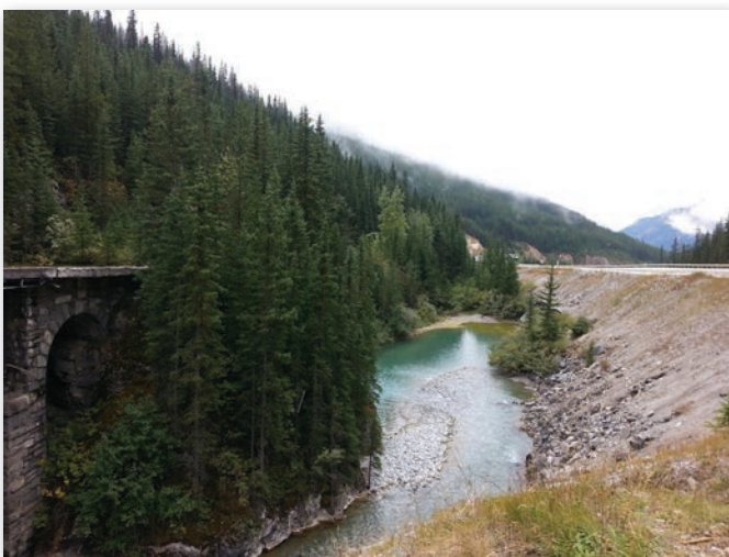
Vue en direction ouest, à partir du bas-côté est. En avant-plan et à gauche de la photo se trouve l'ancien pont. Ce dernier a d'abord été construit pour le transport ferroviaire, puis dans les années 1900, pour le premier réseau routier ( Kicking Horse Road ). Il se trouve aujourd'hui dans les limites du lieu historique national du Col-Kicking Horse et constitue une ressource culturelle d'importance nationale. En contrebas, vue sur la rivière Kicking Horse et en arrière-plan, vue sur Mount Stephen (à gauche) et Mounts Field et Burgess (à droite).

Quant au parc national des Glaciers 3 , le couloir traverse les montagnes emblématiques Selkirk. Elles sont à l'origine d'un système de défense complexe mis en œuvre pour lutter contre les avalanches, d'abord pour la voie de chemin de fer, puis pour la Transcanadienne.