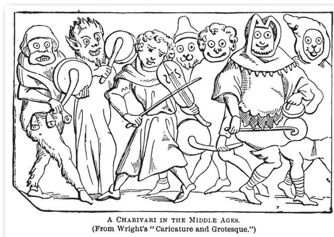
Le Charivari, illustration de Walsh.