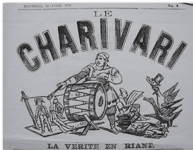
Le Charivari, 30 avril 1878.

Qu'en est-il du charivari québécois? Tributaire des cultures française et britannique, aurait-il emprunté à ces formes?