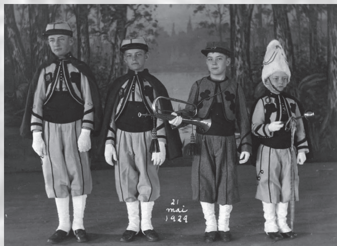
Petits zouaves.