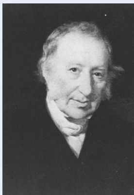
Charles Robin.