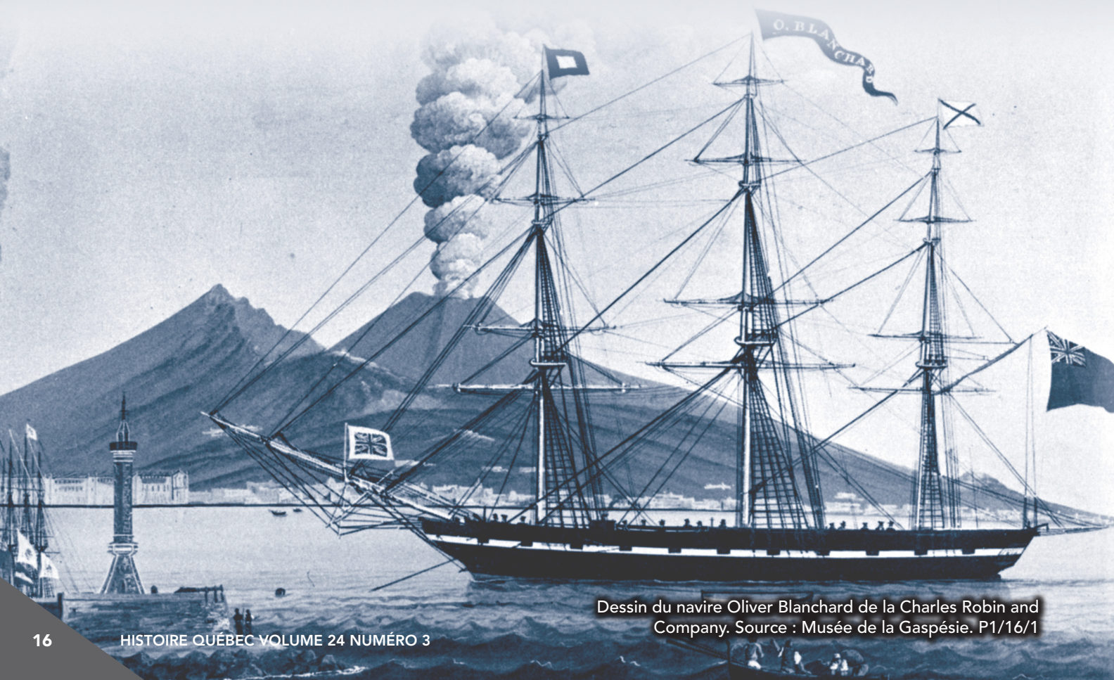
Dessin du navire Oliver Blanchard de la Charles Robin and Company. P1/16/1