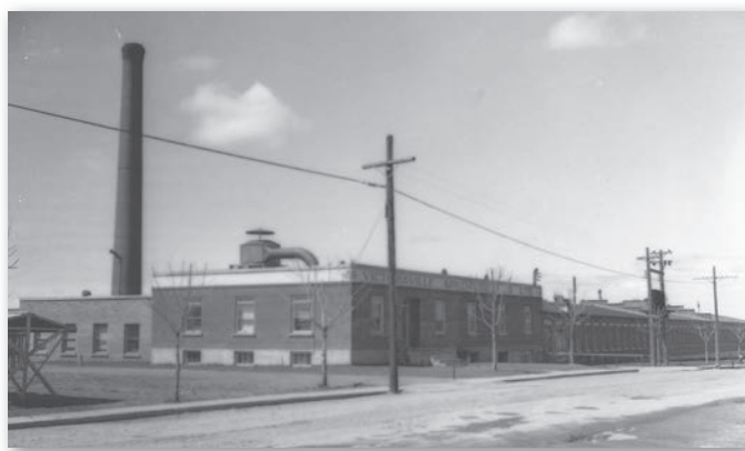
Victoriaville Specialties, Victoriaville.

L'usine de chaises devient Victoriaville Chair Manufacturing en février 1911. En 1913, elle loge un atelier, une chambre de finition et un entrepôt. Deux séchoirs de deux étages et une cour à bois sont adjacents à la manufacture qui emploie 75 ouvriers produisant annuellement 150 000 chaises. En mars 1916, après une liquidation financière, le tout passe aux mains de Canadian Rattan Chair.