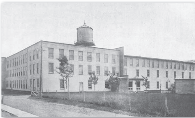
Victoriaville Furniture, Victoriaville, 1930.