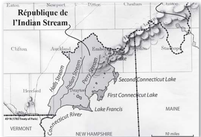
Carte de la république Indian Stream.