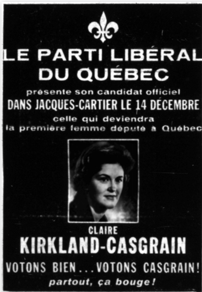
Publicité électorale de 1961 où la candidate et future députée Claire Kirkland-Casgrain est présentée avec les titres masculins de candidat officiel et député .

« "Une ancienne députée", "une journaliste distinguée". — Ne serait-il pas opportun de féminiser ainsi tous les noms masculins de profession, puisque aussi bien presque toutes les professions masculines sont aujourd'hui accessibles aux femmes 4 ? »