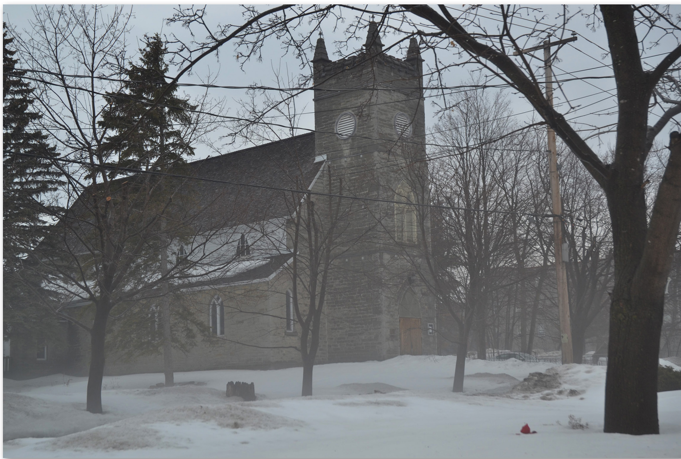
Photo de l'église anglicane Christ Church, à Aylmer.

Certains Aylmerois se souviendront également que l'ancien palais de justice, ayant servi plusieurs années de caserne de pompiers, avait aussi une tour de pierre à l'arrière de l'édifice à l'allure de clocher. Pourtant, cette tour construite vers 1900 servait plutôt à faire sécher les longs boyaux d'incendie. Elle fut démolie en 1962 lors de rénovations comme ce fut le cas pour plusieurs clochers d'Aylmer.