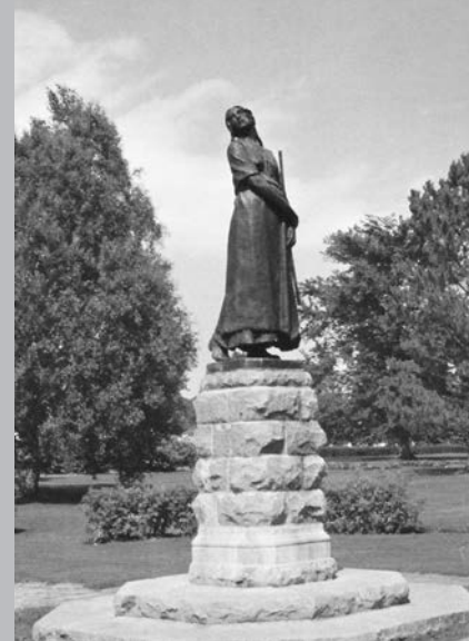
À deux pas de l'église de Grand-Pré, monument élevé à la mémoire d'Evangéline, héroïne de la déportation des Acadiens.