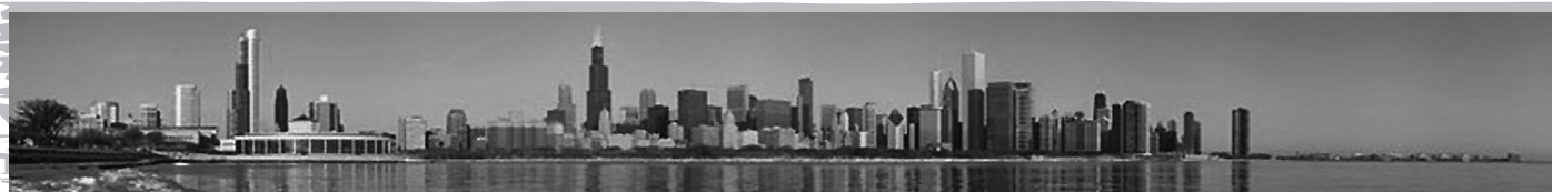
Vue des gratte-ciel de cette immense ville (3 e plus grande ville américaine) qu'est Chicago, Illinois, États-Unis.

La mainmise des États-Unis sur les territoires du Mid-Ouest ne s'opéra vraiment qu'après 1796. C'est pour la consolider que les Américains bâtirent le fort Dearborn sur le site de Chicago en 1804; mais ils durent l'abandonner en 1812, devant les menaces des Indiens qui tuèrent la moitié de la garnison (à l'emplacement aujourd'hui du 68 E. Wacker Place). On recommença à