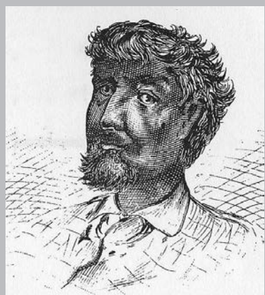
Portrait imaginaire de Jean Baptiste Pointe du Sable, fondateur et premier habitant de Chicago, fils d'un marin français et d'une esclave africaine.

son presbytère, de pur style québécois. Ces deux bâtiments se trouvent d'ailleurs au Québec, sur la pointe entre la rivière Saint-Régis et le fleuve qui s'élargit à cet endroit pour former le lac Saint-François.