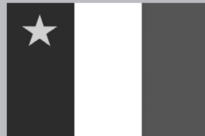
Drapeau de l'Acadie.