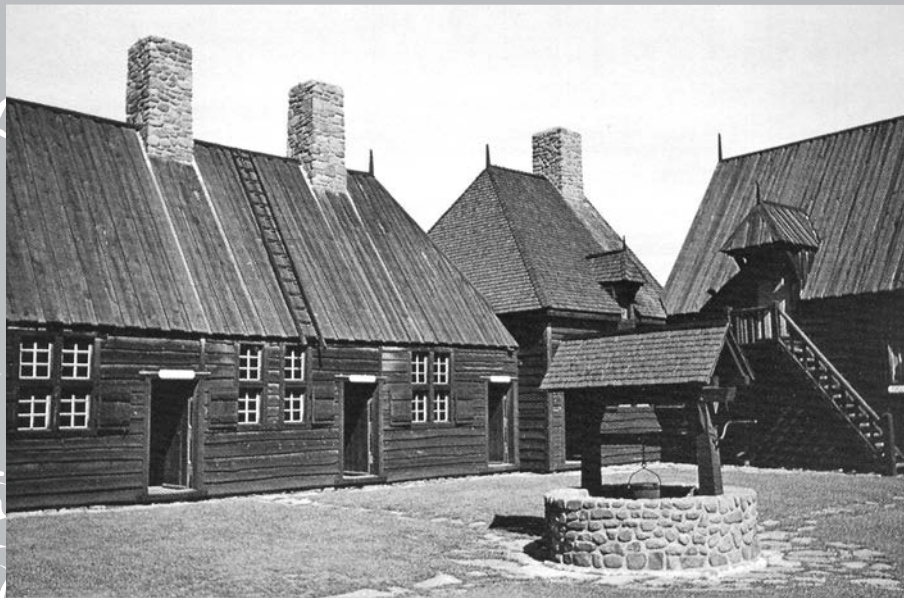
Reconstitution de la cour intérieure de l'habitation de Port-Royal, lieu historique national.

Une fois leur région cédée à l'Angleterre en 1713, leur prospérité a fait l'envie des colons de la Nouvelle-Angleterre; ceux-ci ont établi des postes sur la côte Atlantique et, dès 1749, se sont fait concéder un PARLEMENT, celui de la Nouvelle-Écosse. Pendant ce temps, la France fondait des postes au Cap-Breton, à l'Île Saint-Jean (Île du Prince-Édouard) et en Acadie continentale (par exemple à Sainte-Anne, aujourd'hui Frédéricton), le Nouveau-Brunswick actuel.