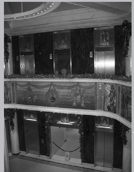
Mosaïque à l'entrée du Marquette Building.

C'est en 1686 que le chevalier Henri de Tonti, mandaté par LaSalle, établit un premier poste de traite et une mission à l'intention des QUAPAWS (le vrai nom des autochtones du lieu, les ARKANSAS – prononcer A-kansaw –, leur a été donné par un