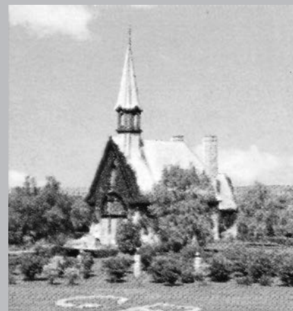
Église de Grand-Pré, Nouvelle-Écosse, lieu historique national d'une communauté acadienne.

Pour le Québécois francophone, l'attrait principal de la réserve est l'église de style gothique avec