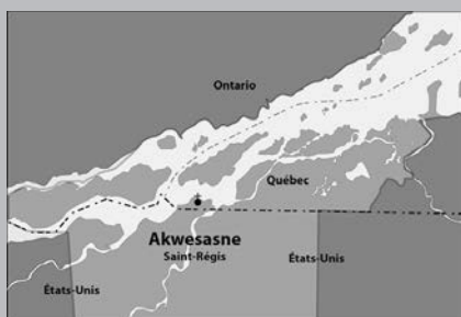
Carte qui chevauche deux pays et trois états. Akwesasne signifiant « là où la perdrix bat des ailes. »