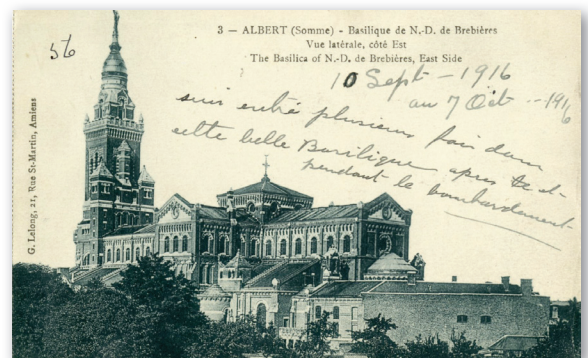
Albert (Somme) – Basilique de N.-D. de Brebières. Vue latérale, côté Est. – [1915] – G. Lelong, Amiens.

Sources : Archives Centre d'histoire de Saint-Hyacinthe – Fonds Napoléon Coderre (CH324) et site Internet du Musée de la guerre au www.museedelaguerre.ca [consulté le 14 juin 2014].