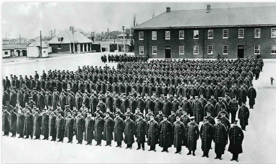
22 e Bataillon canadien-français à Saint-Jean, 1915.