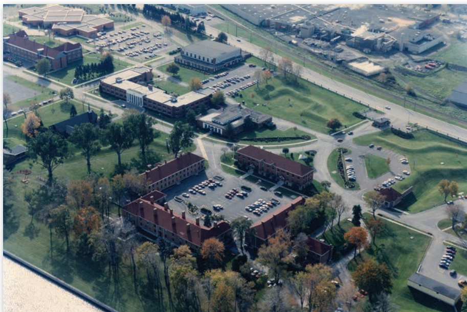
Vue aérienne du Collège militaire royal de Saint-Jean, 1994.

Malgré ces constatations, la Défense nationale développe des outils de perfectionnement et graduellement, se réinstalle à Saint-Jean, louant les installations de l'ancien Collège militaire à la Corporation du campus du Fort Saint-Jean 23 . Finalement, le 19 juillet 2007, la population apprend avec soulagement que le Collège militaire royal de Saint-Jean rouvrira ses portes, avec un nouveau mandat : offrir une formation collégiale reconnue par le ministère de l'Éducation du Québec, en sciences humaines ou sciences de la nature, d'une durée de deux ans (quatre sessions). De