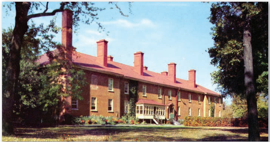
Mess des officiers du Collège militaire royal de Saint-Jean vers 1955. Construit en 1839, l'édifice est toujours présent de nos jours. [Source: Centre d'histoire de Saint-Hyacinthe, fonds Wilfrid Lemoine; carte postale produite par les Éditions Richelieu.]

plus, les élèves ayant déjà obtenu une formation collégiale, ou ceux qui viennent de l'extérieur du Québec, peuvent suivre un programme universitaire d'une année (sciences humaines ou sciences de la nature), équivalente à la première année universitaire du Collège militaire royal de Kingston 24 . Désormais en phase de consolidation, le programme actuel a jeté les bases nécessaires pour envisager l'avenir du Collège avec optimisme. Puisse son demi-siècle d'histoire inspirer aux leaders d'aujourd'hui les leçons nécessaires pour permettre au phénix de renaître de ses cendres.