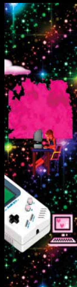
Émilie Gervais, Heaven , 2014.