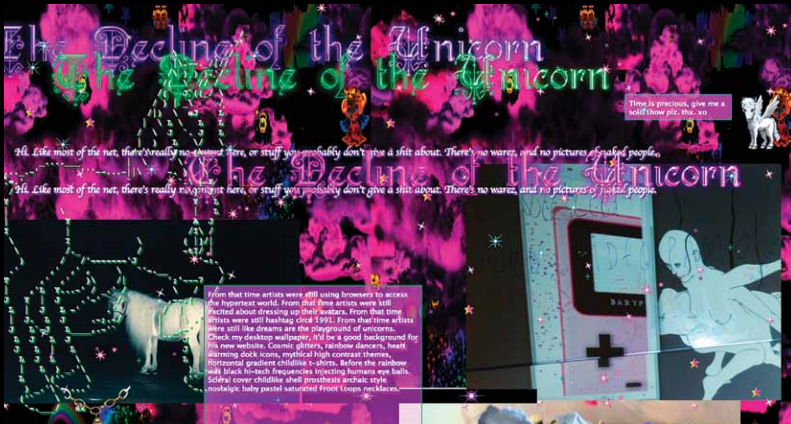
Émilie Gervais, The Decline of the Unicorn (non daté).