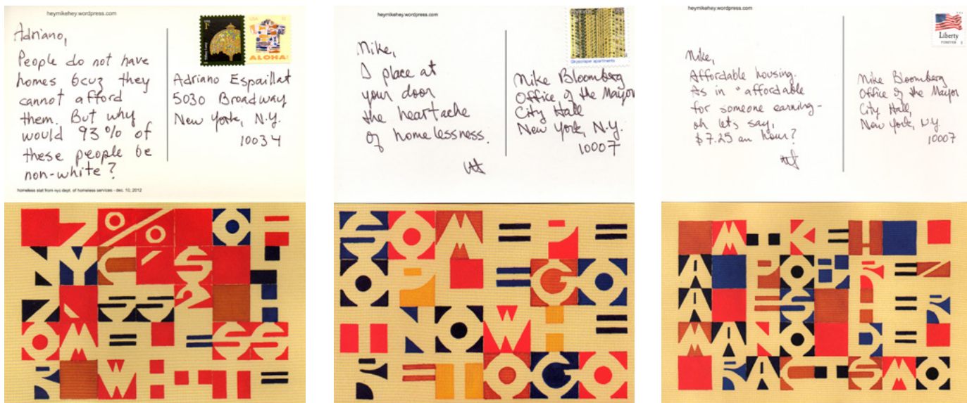
7% of nyc's 47, 552 homeless r white; some people got nowhere to go; mike! la pobreza es hermano del racismo, 2013, cartes postales / postcards, 10 x 15 cm, 10 x 15 cm, 13 x 21 cm

In this sense, the photographs taken by Spencer, published on the Web, also play the role of postcards. Documents of the performance, dated and situated evidence of travel, they make the artist's ephemeral messages permanent. The taking of photographs in the public space, long considered a marker or indicator of urban spectacle, may seem to be in contradiction with the anti-spectacular nature of hey! mike . On the contrary, Spencer's