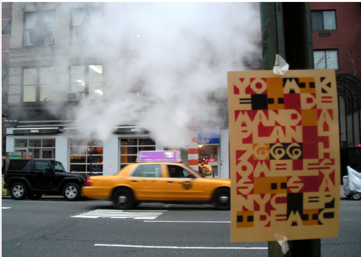
Postcard posted, 2013, New York, document photographique / photographic document