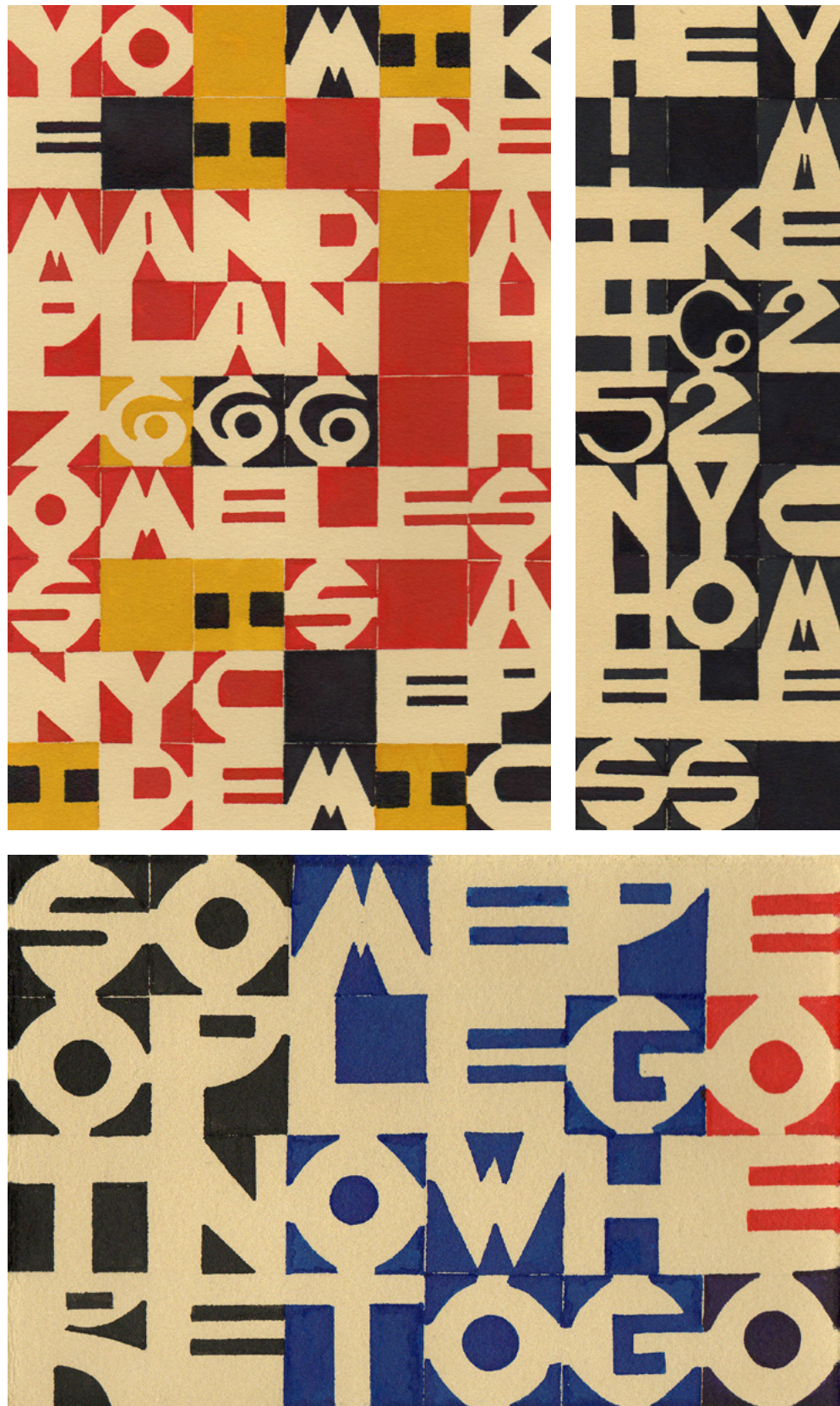
yo mike - i demand a plan 47666 homeless is a nyc epidemic , 2012, encre sur papier / ink on paper, 15 x 23 cm; hey! mike 46252 nyc homeless , 2012, encre sur papier / ink on paper, 8 x 23 cm; some people got nowhere to go (version 3) , 2013, encre sur papier / ink on paper, 10 x 15 cm