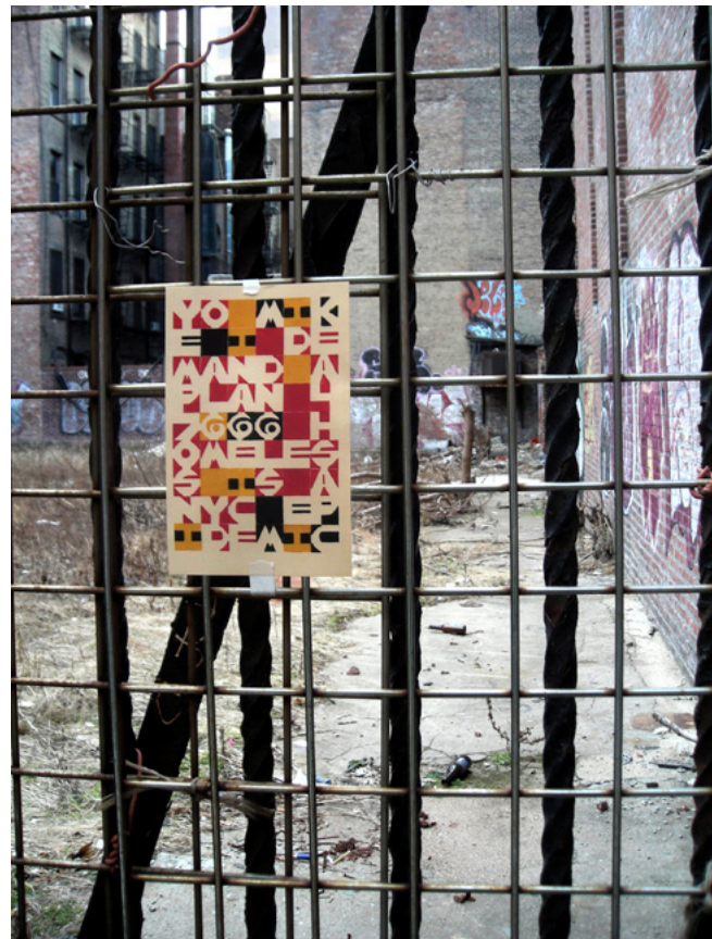
Postcard posted, 2013, New York, document photographique / photographic document