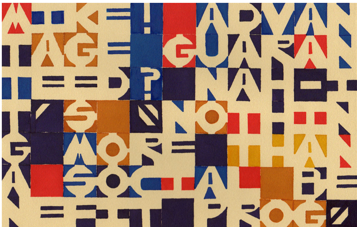
mike! advantage guaranteed? nah - it's «nothing more than a social benefit prog», 2012, encre sur papier / ink on paper, 18 x 27 cm

collaboration avec les centres d'artistes Dare-Dare (Montréal), Article (Montréal), Praxis (Sainte-Thérèse) et le 3 e impérial (Granby). Prise et partage de notes, inscription de courtes phrases à l'encre sur divers supports physiques, déambulation de l'artiste – et, in extenso , de ses mots – dans l'espace public, prise de photographies et de vidéos documentaires, utilisation de la poste, de sites Web et de divers réseaux sociaux comme Twitter ou Facebook sont autant de stratégies communicationnelles qui mettent en question le rôle de l'artiste en société et notre rapport au transitoire, à la ville, à l'habitat, à la citoyenneté, aux structures de pouvoir, à l'ordre établi et au politique.