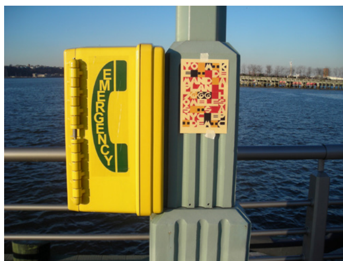
Postcards posted , 2013, New York, document photographique / photographic document; PAGE 50 : blog as studio artist as circulator , 2012, encre sur papier / ink on paper, 18 x 13 cm

nos sociétés, rendant tangible le flux constant entre la constitution d'un espace privé domestique et celle d'un espace public politique, entre la constitution du Soi et l'identification de l'Autre. L'artiste, créant elle-même ses cartes postales en partant de ses explorations typographiques, renverse la tendance à l'idéalisation, la réinvestit d'un autre pouvoir qui est moins celui du contrôle idéologique d'un espace que celui de l'échange potentiel.