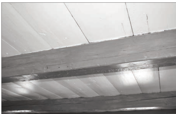
Lorsque le dessous des planches qui fait office de fini de plafond est déjà peint, il suffit de bien le nettoyer et de le repeindre.