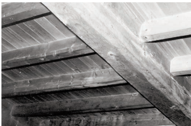
Pour redonner une patine chaleureuse aux poutres et au dessous des planches au bois nu, il faut appliquer de l'huile de lin bouillie ou de la cire d'abeille.