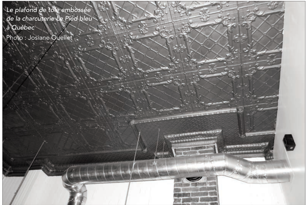
Le plafond de tôle embossée de la charcuterie Le Pied bleu à Québec

Vers la fin du XIX e siècle, le plâtre, valorisé à l'époque victorienne, a progressivement remplacé le bois comme fini de