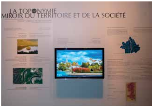
L'exposition itinérante Le nom de lieu, signature du temps et de l'espace a d'abord été présentée au Musée de la civilisation en 2012. Elle s'arrêtera au Musée amérindien de Mashteuiatsh après les Fêtes.