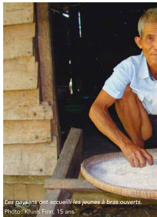
Les paysans ont accueilli les jeunes à bras ouverts.

La coopération internationale prend toutes sortes de formes.