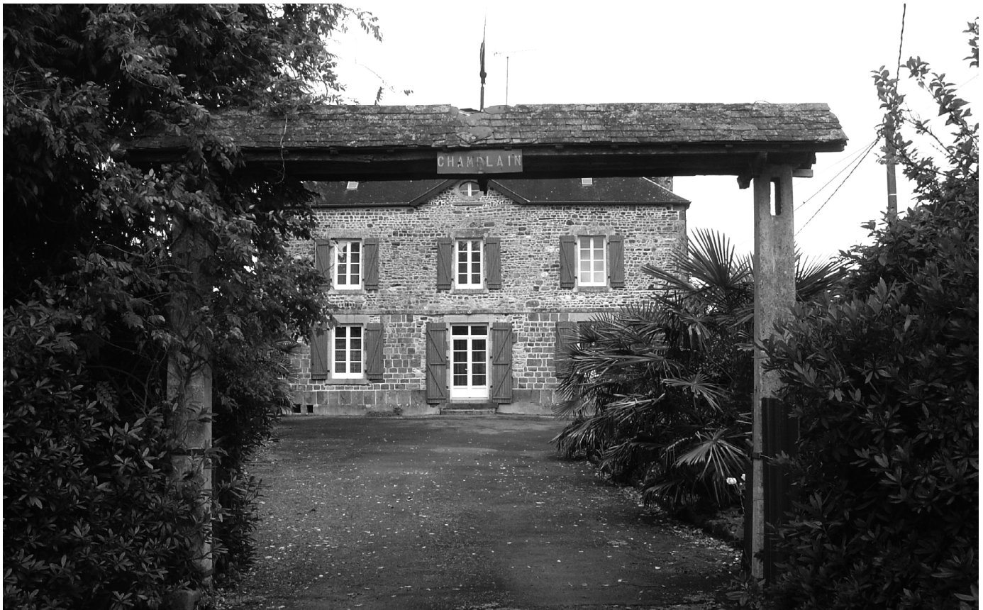
Ferme de Champlain à Saint-Pierre-des-Landes.

de son fils sur les origines de sa famille. Alors qu'il se dit « noble homme » et « sieur de Champlain », Samuel n'évoque jamais la noblesse de ses ancêtres, peut-être parce qu'il la sait entachée. Les fils naturels de gentilshommes sont traditionnellement considérés comme nobles car la noblesse est transmise par le père, mais à l'époque du fondateur de Québec, les temps changent. L'âge d'or des bâtards se termine. La noblesse des fils naturels de nobles commence à être remise en cause et Samuel de Champlain en fait sans doute la cruelle expérience. Des contemporains n'hésitent pas à lui retirer sa particule. Il y a Claude de Monstr'œil, éditeur de ses Sauvages en 1603, qui le fait sur la page de titre et dans la signature de la dédicace à l'amiral de Montmorency, et surtout le mordant Marc Lescarbot qui, dès les premières éditions de son Histoire de la Nouvelle-France et de ses Muses de la Nouvelle-France , ne l'appelle que « Mon-