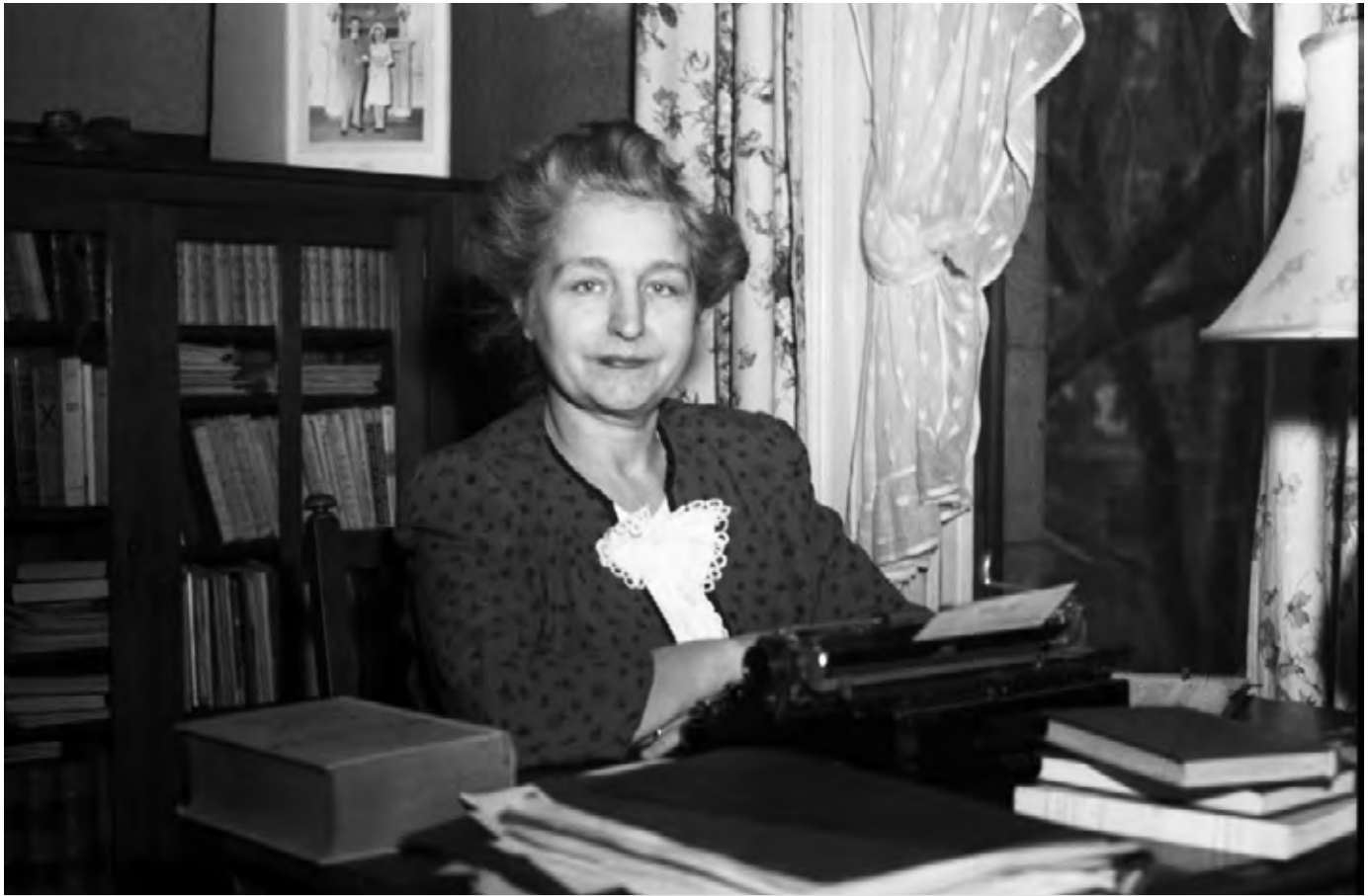
Germaine Guèvremont à sa machine à écrire, en 1946.