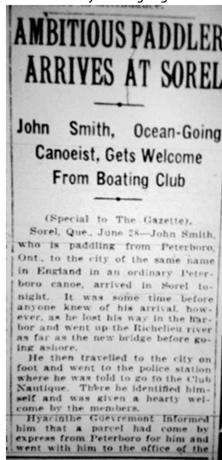
Extrait d'un article de Germaine Guèvremont. ( The Gazette )

typographe de La Voix des érables lui annonce qu'il a une nouvelle, alors qu'il parle en fait de fruits : « L'abondance des fraises est arrivée! » (TSJ, p. 99) Et sans doute les saisons et les récoltes nourrissent-elles l'ennui de mademoiselle Papillon ou de Caroline Lalande, mais l'attention minutieuse de Guèvremont pour les cycles et la monotonie du monde paysan supplante les insatisfactions de ces personnages journalistes. Les répétitions du milieu qui l'intéresse s'inscrivent dans une compréhension plus profonde et plus large de ce monde qu'elle mettra en scène dans ses romans. Dans une conférence au Toronto Women Press Club, Guèvremont parle en fait avec nostalgie de ce temps où elle observait les pulsations du paysage sorelois : [...] when spring comes along and ice-breakers out their way through the ice bridge and and free the St-Lawrence waters and the blue-winged teal sails north, I begin to wonder restlessly what is going on at Sorel