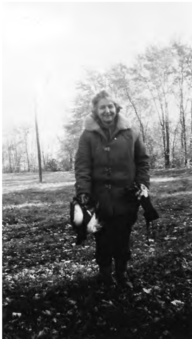
Photo de Germaine Guèvremont revenant de la chasse aux canards.

version auprès d'une autre de ces femmes journalistes : Caroline Lalande. Plus consistante encore, l'histoire de Caroline Lalande se déroule dans un roman-feuilleton en dix-huit étapes publiées entre 1939 et 1940 dans la revue Paysana . Sous-titrés « Étude de la vie réelle », les épisodes relatent le passage de la jeune femme au journal local de l'Anse-à-Pécot, La Voix des érables , et son travail de correspondante pour le People . Le feuilleton s'ouvre sur la tentative de suicide de Caroline Lalande, jeune paysanne qui fait long feu après avoir déménagé à Montréal avec ses rêves d'écrivaine. Le suicide est encore passible d'incarcération à l'époque, mais Caroline