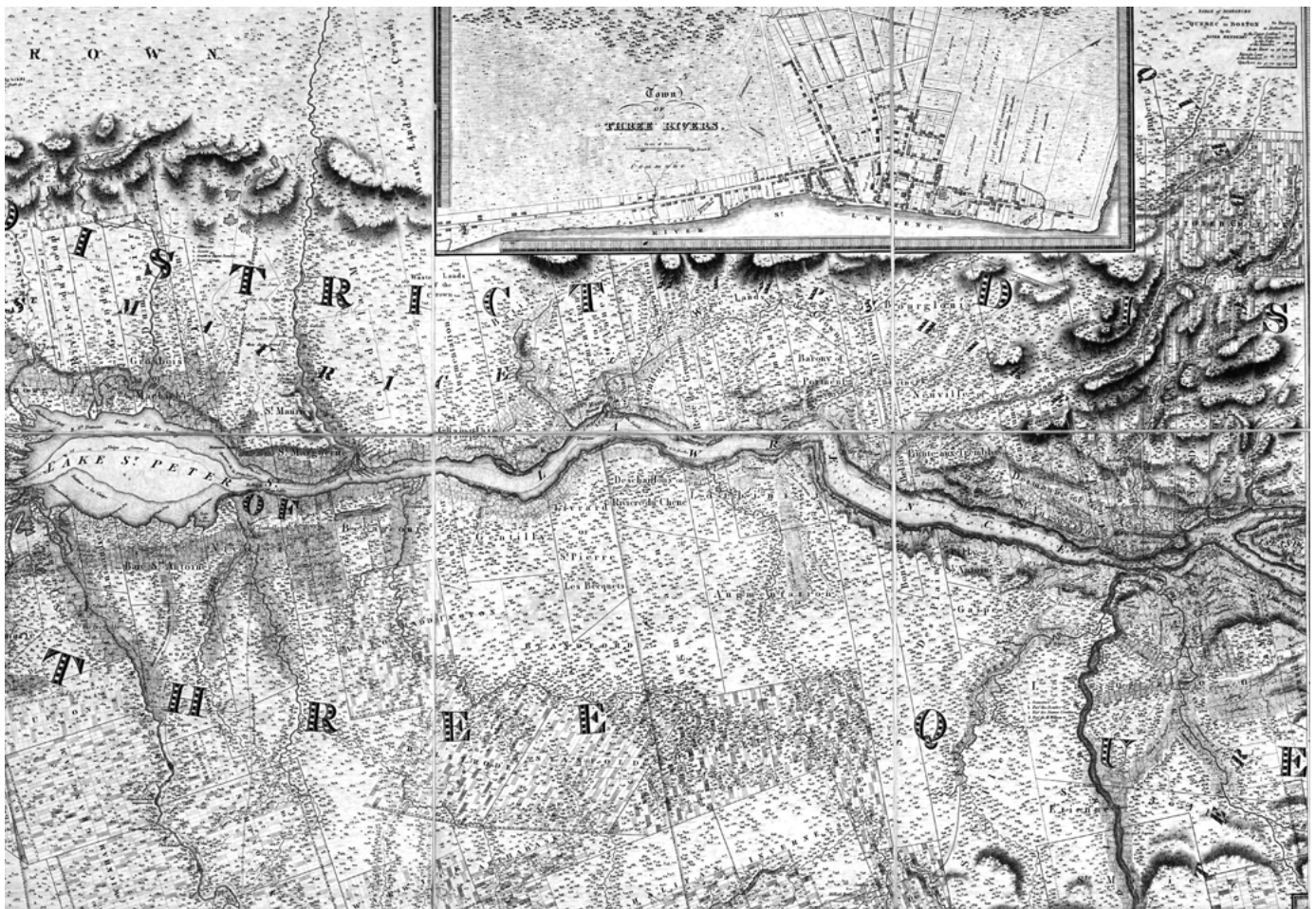
À l'est du canton de Grantham, on peut lire sur le site de Drummondville : « Rapids almost impassable ». Joseph Bouchette. This Topographical Map of the Province of Lower Canada... Londres, William Faden, 1815, détails.

Dans quelle mesure cette stratégie de peuplement favorise-t-elle le développement de Drummondville au XIX e siècle? Les townships sont d'abord peuplés par des loyalistes au début du XIX e siècle. Ceux-ci s'établissent au sud de la région et ont peu de liens avec les pionniers qui accompagnent Frederick George Heriot. Puis à partir des années 1820, une courte vague d'immigration anglaise arrive dans les cantons. Ces nouveaux arrivants ne