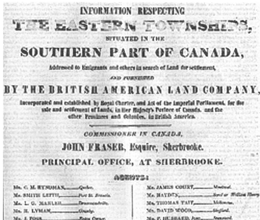
Cette publicité de la BALC vise à promouvoir l'immigration britannique dans les townships . British American Land Company. Information respecting the Eastern Townships, situated in the southern part of Canada... London, BALC, 1842. (BAC).

Québec. Ministère de la Culture et des Communications. « British American Land Company », Répertoire du patrimoine culturel du Québec, http://www.patrimoine-culturel.gouv.qc.ca/rpcq/detail.do?methode=consulter&id=14254&type=pge#.VYQxtWBZHZ- . Page consultée le 19 juin 2015.