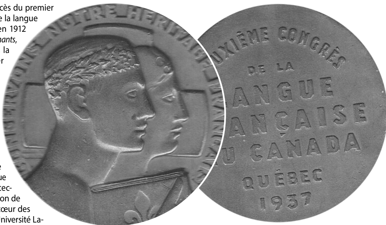
Avers et revers de la médaille du Deuxième Congrès de la langue française, en 1937. (Collection de l'auteur).

Il redonne vie au Comité permanent des congrès de la langue française, créé à la suite du congrès de 1912, mais demeuré inactif. L'organisme est incorporé en 1940 sous le nom de Comité permanent de la survivance française et prend comme devise « Conservons notre héritage français ». Il aura comme mission immédiate la publication des actes du congrès. Il devient, en 1955, le Conseil de la vie française en