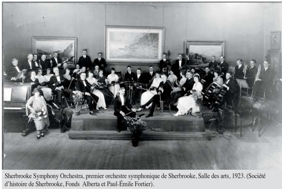
Sherbrooke Symphony Orchestra, premier orchestre symphonique de Sherbrooke, Salle des arts, 1923.