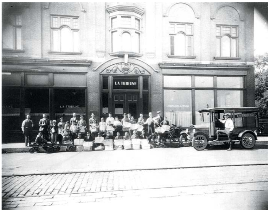
Groupe d'employés du journal La Tribune, devant le Art Building, 1928.