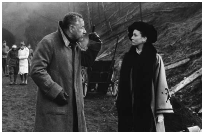
La Vie et rien d'autre

instructions et d'essayer de le faire au mieux, ils finissent par devenir des emmerdeurs, parce qu'ils font apparaître à la fois tous les gens qui ne le font pas bien et surtout le fait que personne au-dessus d'eux n'a envie qu'on fasse bien le travail. Personne.