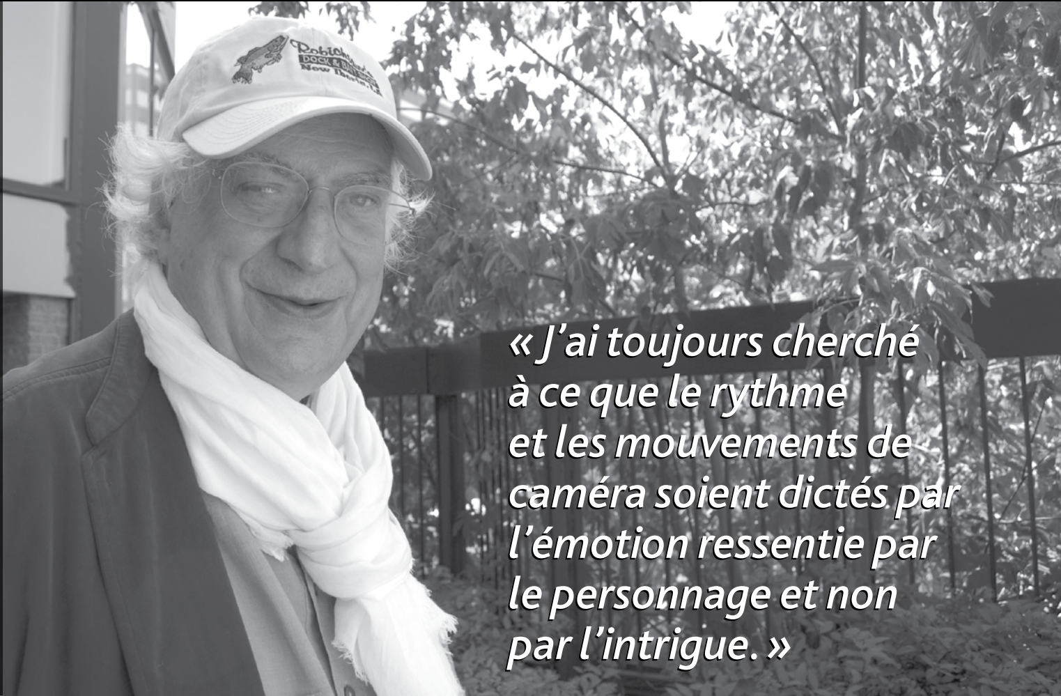
Bertrand Tavernier