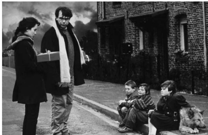
Ça commence aujourd'hui

je pense que le personnage n'a pas envie de dire ça, il n'est pas prêt, laisse-le vivre.» Ça a été une des premières leçons, très importantes, que je n'ai jamais oubliée : laissons vivre le personnage.