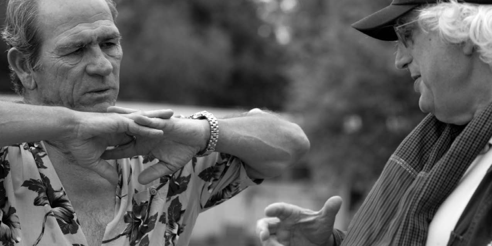
Tommy Lee Jones et Bertrand Tavernier sur le tournage du film Dans la brume électrique

les gens à qui il a demandé de tuer? Il ne suffit pas de dire: « Vous ne tuez plus. Avant on vous récompensait, maintenant on va vous punir si vous tuez. »