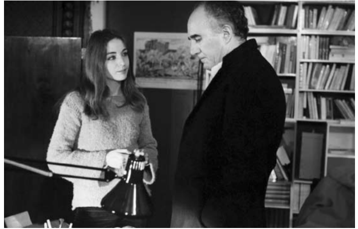
Des enfants gâtés

C'est gênant de prendre parti pour un ange exterminateur.