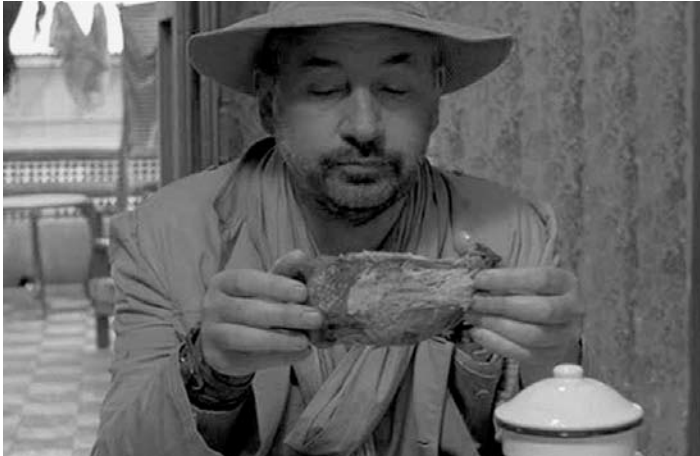
Coup de torchon