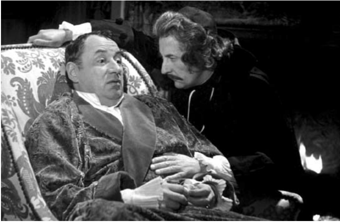
Que la fête commence