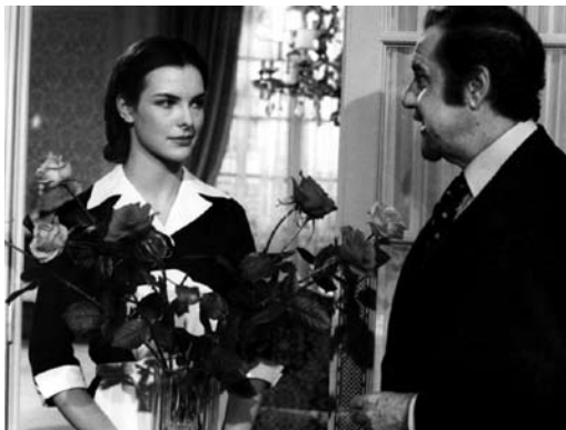
Cet obscur objet du désir

Dans Vertigo (1957) d'Alfred Hitchcock, le complexe jeu de doubles obéit aux lois classiques du suspense. Ex-détective en proie à de terribles vertiges, John Ferguson (James Stewart) est chargé de suivre une femme sujette à d'étranges absences. La belle Madeleine (Kim Novak) semble s'identifier à son arrière-grand-mère, Carlotta Valdès, morte folle et suicidée : une obsession morbide qui a toutes les apparences de la possession. Madeleine contemple longuement le portrait de Carlotta au musée, loue une chambre d'hôtel sous le nom de Valdès, adopte la coiffure de son aïeule, porte ses fleurs et affiche la même âme fragile. Ainsi un premier double est-il établi. Doutant de la thèse du surnaturel, Ferguson n'en tombe pas moins amoureux de la jeune femme. Un amour qui n'empêchera pas Madeleine de se jeter du haut de la tour d'une église sous les yeux de son amant impuissant... Cette disparition donnera alors naissance à un nouveau double. Lorsque Ferguson rencontre Judy, véritable sosie de la morte, il fait revivre Madeleine, sa chevelure platine, son chignon et ses tailleurs.