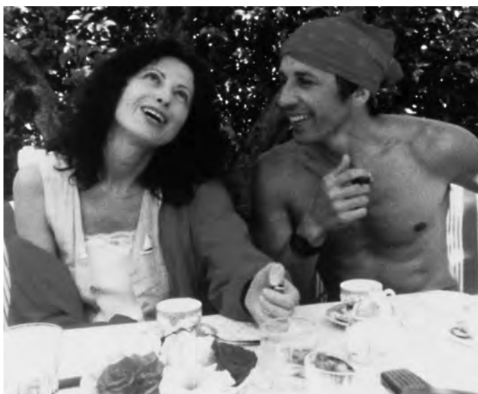
Les Nuits de la pleine lune, L'Ami de mon amie et Le Rayon vert