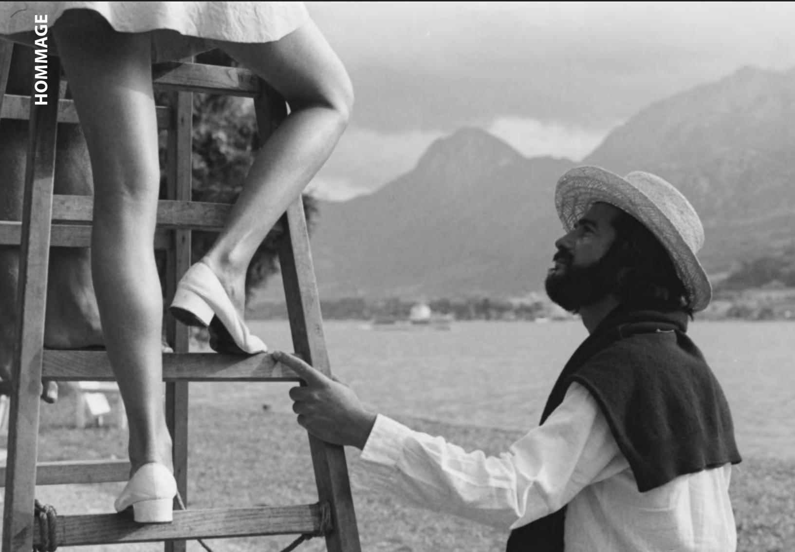
Le Genou de Claire