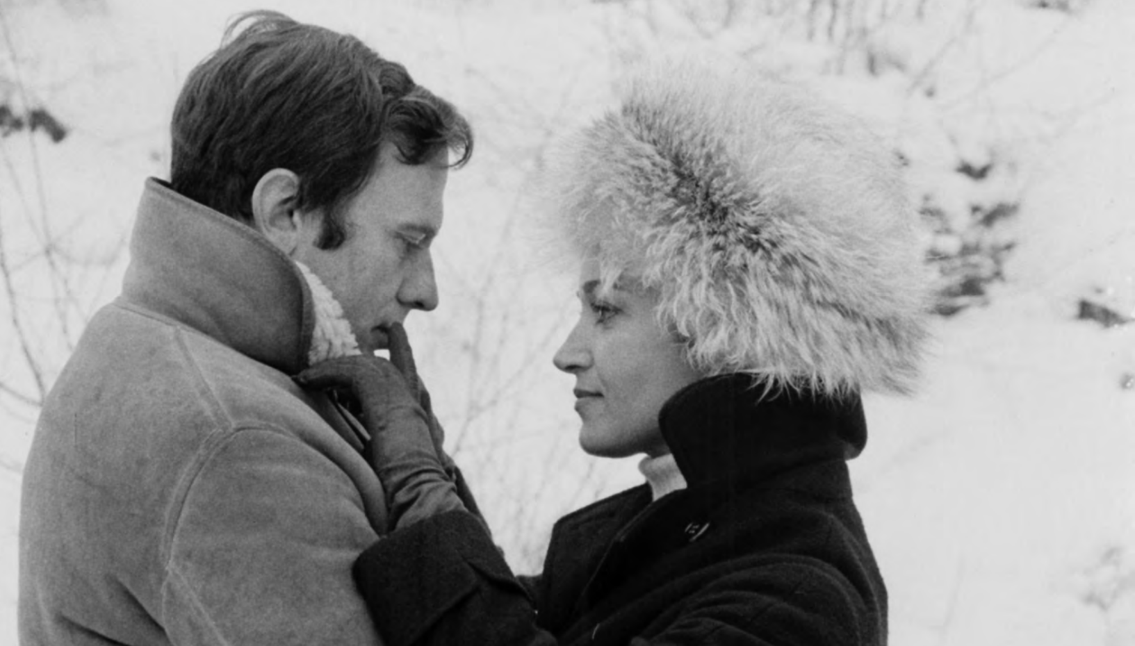
Ma nuit chez Maud

âge, Luchini y affiche déjà le caractère hors norme qui habitera ses futures prestations au grand écran. Par ailleurs, on sait que l'acteur fera partie de la distribution de cinq autres films du cinéaste et non les moindres: Perceval le Gallois , La Femme de l'aviateur , Les Nuits de la pleine lune , Quatre Aventures de Reinette et Mirabelle ainsi que L'Arbre, le Maire et la Médiathèque .