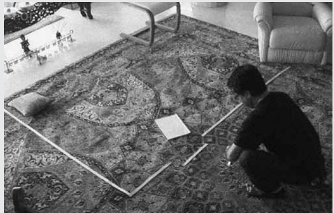
Jafar Panahi dans Ceci n'est pas un film

Assigné à résidence depuis 2010, Panahi a malgré tout réussi à réaliser un film, intitulé Ceci n'est pas un film (2011), envoyé au Festival de Cannes sur une clé USB cachée dans un gâteau. Le titre l'indique clairement : ce journal filmé du réalisateur iranien n'est pas un film au sens conventionnel du terme, mais plutôt un acte de survie en des temps dangereux. La petite chronique que livre Panahi, et dans laquelle il se laisse découvrir à travers ses activités quotidiennes (un déjeuner, un appel à son avocat, etc.), est un admirable geste de résistance à l'oppression dont il est victime. Même enfermé entre quatre murs, il continue de clamer sa foi dans l'importance de prendre la parole par le biais de l'art. Ceci n'est pas un film est la preuve de l'extrême lu-