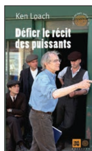
Défier le récit des puissants Ken Loach Éditions Indigènes Paris, 2014, 46 pages