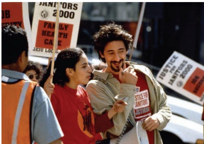
Bread and Roses