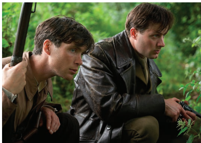
The Wind That Shake the Barley

images est d'amadouer le spectateur ou de lui procurer un repos, ou encore tout simplement de changer son univers. Cette esthétique du divertissement n'est pas seulement apolitique, elle est en réalité un adversaire de la politisation du cinéma. En second lieu, l'approche esthétique de Loach, que l'on a qualifiée de « réaliste », n'en est pas moins soucieuse de beauté formelle. L'esthétique réaliste de la résistance ne signifie en rien l'abolition du beau. Même dans ses films les plus durs ou les plus crus, Loach cherche à émouvoir. Si nous pouvons éprouver de la colère devant des scènes d'injustice, le cinéaste entend nous conduire plus loin, à dépasser celle-ci et à voir au-delà de la misère et de l'oppression. Dès lors, la beauté devient un outil pour défier les puissants.