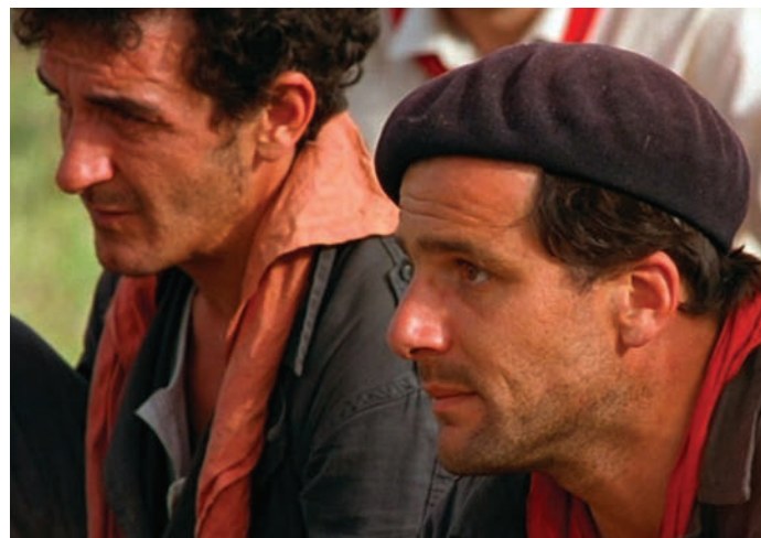
Land and Freedom

de la culture, et donner la parole à celles et à ceux qui autrement demeureraient dans l'ombre. Dans ses meilleurs films, surtout ceux des 10 premières années, Loach filme les marginaux, les écopés, les ratés, tous ces « perdants magnifiques », sans misérabilisme ni glorification. Il insiste également pour que nous puissions entendre une langue parlée, et non un langage policé et par ce fait même déconnecté du monde. Cela lui a d'ailleurs valu de voir son film Sweet Sixteen interdit au moins de 18 ans, en raison du langage cru utilisé par ses personnages. Pour Loach, cette interdiction représentait le comble du ridicule. Dans une lettre au quotidien The Guardian au moment de la sortie du film 1 , le scénariste du film, Paul Laverty, qui a aussi écrit la plupart des films de Loach depuis Carla's Song en 1996, s'étonnait qu'une société comme la Grande-Bretagne, qui juge les adolescents capables d'avoir des permis de conduire et des passeports, d'aller en prison, les juge trop jeunes pour voir un film utilisant un vocabulaire qui est pourtant le leur.