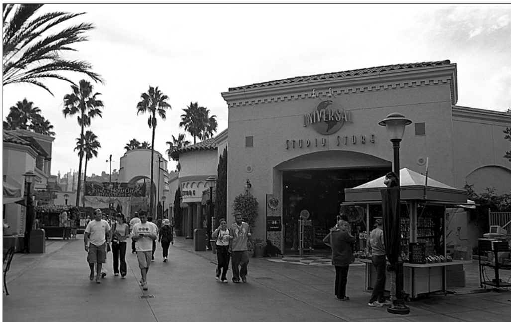
ILLUSTRATION 1 : Les touristes, attirés par les activités cinématographiques, visitent notamment des studios de cinéma.

cinéma du monde entier (producteurs, réalisateurs, scénaristes, etc.) et aux responsables des villes et des régions intéressées à accueillir des équipes de tournage, confirme aussi l'intérêt des destinations à convaincre les producteurs de cinéma de tourner et filmer dans certains lieux (Désiront, 2009). Les voyagistes et les agents de voyages sont aussi invités puisque le ciné-tourisme constitue pour eux un filon à exploiter, avec les circuits qui emmènent les voyageurs sur les lieux qui ont servi de décor à des films populaires (Désiront, 2009) (voir illustration 2).