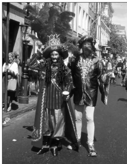
Mardi Gras, Nouvelle-Orléans.

Le trafic de femmes existe comme il a existé par le passé. Storyville est un des lieux particuliers en Amérique du Nord qui a accueilli ce type de trafic, mais il ne fut pas le seul puisque New York, Chicago, Montréal, Boston, Seattle ou San Francisco s'y sont illustrés. Le trafic des femmes à travers l'Europe a été officiellement reconnu en 1877 lors d'une conférence internationale à Genève. En 1902, la France sous la pression de la réalité de la traite des Blanches, organisa une conférence internationale qui aboutit à un « arrangement international en vue d'assurer une protection efficace contre le trafic criminel connu sous le nom de traite des blanches » 9 . Cet agrément fut officiellement ratifié par le Président Roosevelt en 1908 et suivi d'une loi interdisant le trafic de personnes à travers les états ou en provenance de l'étranger, le Mann Act de 1910.