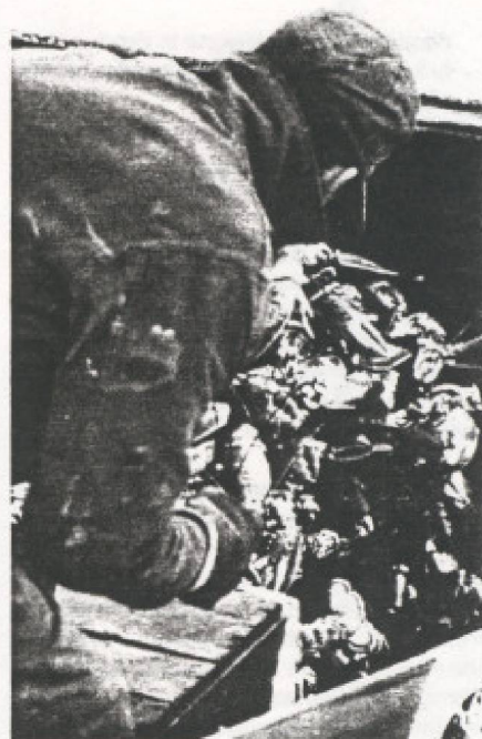
L'activité touristique risque aussi d'entrer en conflit avec d'autres activités économiques...

Face aux autres activités économiques régionales, l'aménagement touristique suppose dès lors une série de choix souvent difficiles. La première étape dans cette démarche consiste à cerner le caractère attractif de la région ou plus spécifiquement d'un certain nombre de sites de cette même région à partir des flux touristiques. Les modèles de "gravitation-inertie" permettent (même s'ils ont des limites importantes) de se faire une certaine idée de la vocation touristique d'une région ou d'un site. Dans une forme générale et simplifiée les principaux