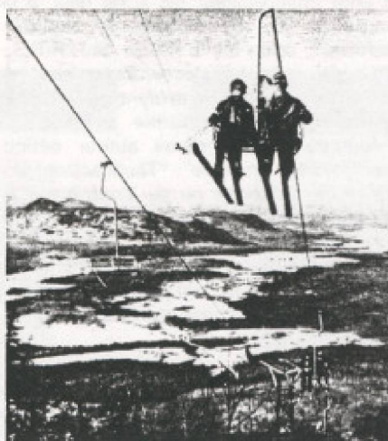
Le tourisme: une activité saisonnière... L'aménagement des stations de ski doit tenir compte de facteurs physiques très particuliers.

La solution à ce type de problème réside dans une planification des activités touristiques. Il importe de créer des activités com-