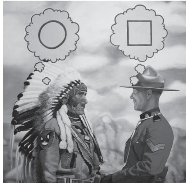
Figure 1. David Garneau, Not To Confuse Politeness With Agreement , 2013, huile sur toile, 122 x 122 cm.

Liée au pouvoir, la langue transmet les manières de voir et de faire, les perspectives du monde, l'esprit, le souffle même des peuples. En se voyant imposer les langues des cultures dominantes, les Autochtones du Canada ont été contraints de naviguer entre deux systèmes, deux cultures, sans arriver nécessairement à les maîtriser totalement. Si certains ont réussi à composer avec cette complexité, d'autres sont demeurés déstabilisés, voire défaits. Bien que de nombreuses communautés parlent toujours la langue ancestrale, cette continuité s'est réalisée au prix