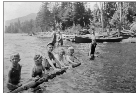
La nature comme écrin d'une vie authentique.

En dépit du faible nombre de représentations iconographiques de cette partie nord du paysage du lac (soit 16 sur Lac-Tremblant-Nord et 33 sur la partie sud du lac, village Tremblant), leur analyse qualitative permet un deuxième constat, de remarquer la non-figuration de l'habitat de manière systématique, bien que ce dernier soit présent et fondu dans la nature. Cela est susceptible d'attester d'une volonté plus ou moins consciente