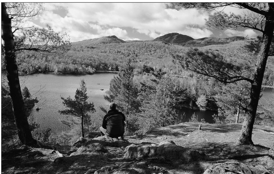
Vue de l'observatoire du Mont-Orford.

Pour cela, dans une première partie, nous revenons sur la spécification d'un territoire à partir des interactions sociales. Nous faisons l'hypothèse du rôle-clé de la dynamique interne d'un conflit sur le processus de spécification. Dans une deuxième partie, nous présentons le cas du conflit du PNMO et, dans une troisième, nous rendons compte des résultats de l'analyse fonctionnelle de ce conflit. Celle-ci révèle à la fois un conflit d'usages et un conflit de valeurs sur la Nature et, par conséquent, sur sa mise en valeur. Dans une dernière partie, nous montrons comment la dynamique interne du conflit pèse sur la spécification du territoire, passant d'un état d'absence de solutions de valorisation innovantes à celui d'un possible consensus autour de la défense d'un bien public.