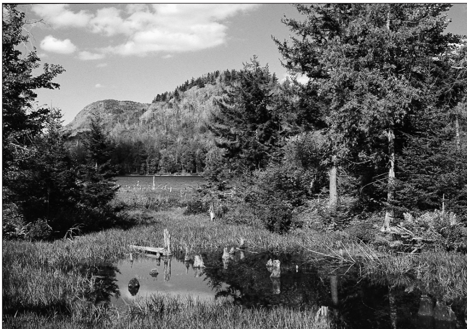
Étang Horiz, Parc national du Mont-Orford.

L'intérêt des adversaires à construire ce point focal a pour conséquence l'absence de tout autre projet de valorisation. Contrairement à certains cas de mobilisation contestataire à des projets d'aménagement, les opposants au projet ne cherchent pas ici à légitimer leur position par le biais d'un projet alternatif. La question du type de tourisme à privilégier dans une optique de développement durable et viable n'est pas directement abordée. L'innovation que requiert par exemple un projet écotouristique ne s'incarne pas ici dans la nature du projet lui-même, mais dans la remise en cause du pouvoir politique et de la définition de l'intérêt général. Des préoccupations générales de défense environnementale, la défiance vis-à-vis du gouvernement et les critiques à l'égard des procédures de décision, jugées trop arbitrales ont tendance à l'emporter, plaçant la contestation plus sur le plan politico-administratif et moins orientée sur la structuration d'un projet alternatif.