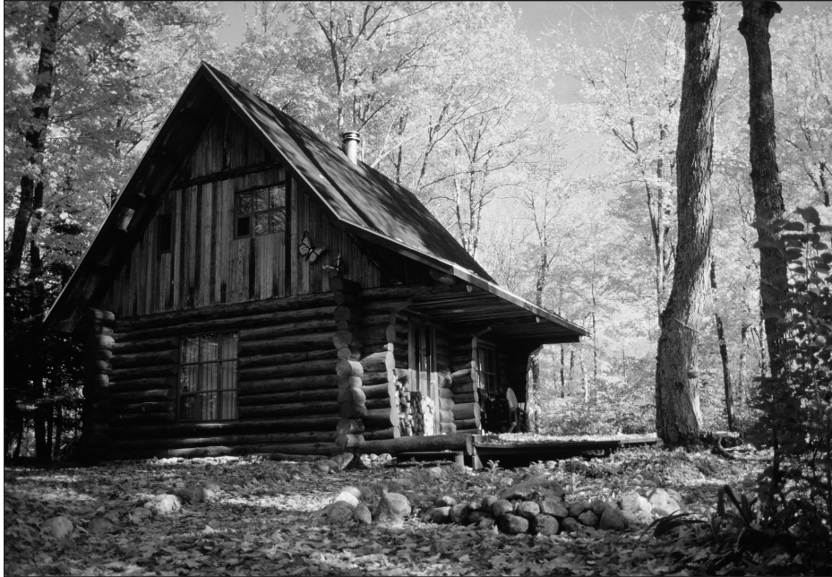
Maison en bois rond, Laurentides.