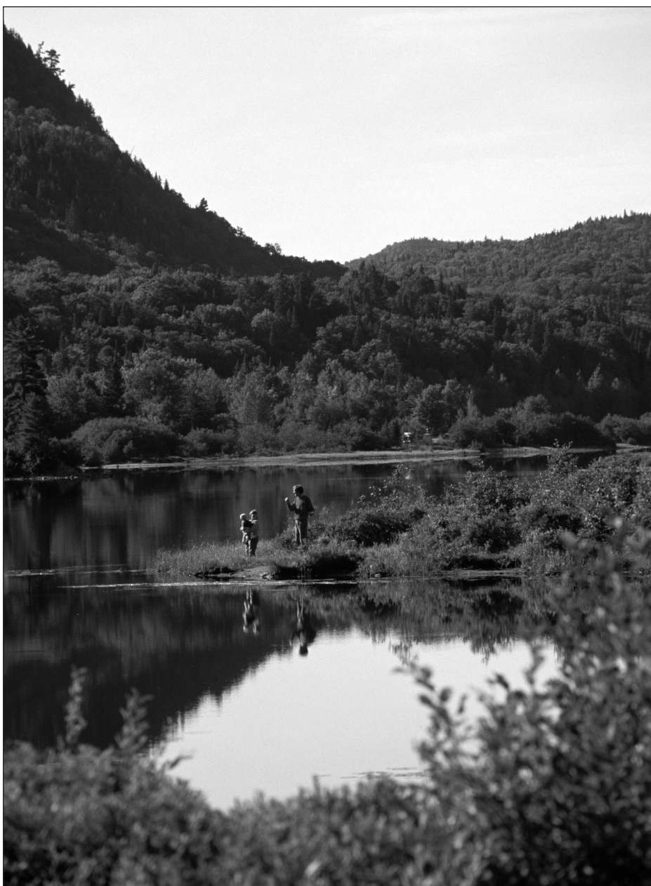
Laurentides, Parc national du Mont-Tremblant, Laurentides.

Tel qu'indiqué dans l' Encyclopédie du tourisme (Jafari, 2000), tout ce qui est acheté lors d'un voyage peut être appelé un produit touristique. Plus exactement « un produit est tout ce qui peut être offert pour satisfaire un besoin ou un désir » (Kotler et al., 2000 : 10). Il y a des cas où le concept de produit s'applique aussi à des services gratuits, comme certains loisirs (exemple : une balade à vélo), ou à des biens publics (un paysage), donc où le produit ne nécessite pas une transaction explicite entre un