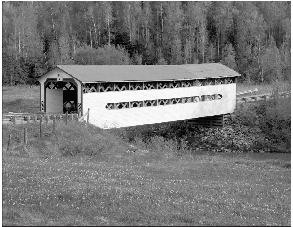
Pont couvert Dénommée, Saint-Bruno-de-Guigues, Abitibi-Témiscamingue.

Il est assez largement reconnu aujourd'hui que le produit touristique peut être l'ensemble des activités réalisées par le touriste à partir du moment où celui-ci quitte son espace habituel de vie et ce, jusqu'à ce qu'il y retourne. Pour plusieurs, le produit touristique correspond ainsi à l'ensemble du périple. Les diverses consommations