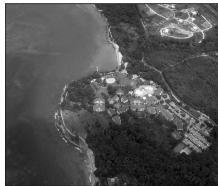
L'enclave du Village Pierre et Vacances à Sainte-Lucie (Martinique).

Les événements des dernières années ont souligné l'importance des conditions géopolitiques sur le tourisme international et les inquiétudes suscitées par les attentats du 11 septembre 2001 semblent avoir précipité la réorganisation du marché : si la Caraïbe jouit d'une image de « paradis sécurisé », de destination où les risques sont parmi les plus faibles pour les touristes, c'est en grande partie grâce au large regroupement des touristes dans des zones enclavées. La région doit en effet supporter d'importantes tensions sociales, des poches de pauvreté et des territoires non contrôlés aux mains de la criminalité organisée, des gangs et des cartels de la drogue (qui ont aussi leurs entrées dans certaines stations comme Acapulco et Negril ; De Albuquerque et McElroy, 1999). Dans les villes touristiques, comme La Havane ou San Juan, sont définis des « carrés touristiques », périmètres haute-