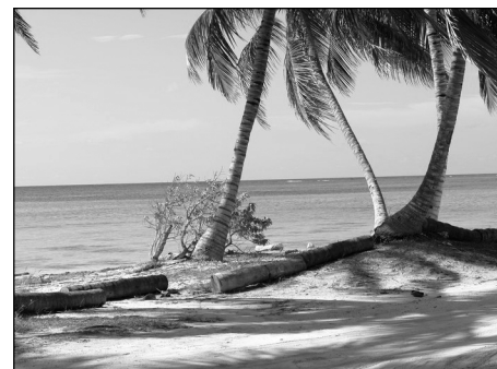
Plage à Punta Cana en République dominicaine.

Ces remarques permettent de distinguer les revenus réels du tourisme et de mieux comprendre les difficultés économiques de certaines îles au cœur des dynamiques touristiques. En filigrane, la question fondamentale qui se pose est celle du prix de revient du produit touristique au regard des ressources consommées localement et des investissements, notamment en termes d'infrastructures, financés par les autorités locales ; plus