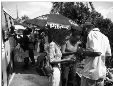
Les petits vendeurs se regroupent sur les circuits touristiques qui relient les principales curiosités de l'île (Sainte-Lucie).

Le tourisme pose ici la question de l'intégration des communautés locales dans ces pays où les différences politiques, raciales et culturelles alimentent les conflits latents. Les alliances entre des groupes dominants locaux – qui accaparent la plus grande part des revenus – et des pouvoirs exogènes sont sources de tensions. Les choix de développement en matière d'infrastructures sont parfois contestables et certaines communautés se sentent négligées, voire exclues. Par ailleurs, les dérives des pratiques dans certains lieux touristiques ne sont pas sans perturber des sociétés locales qui se replient sur des cultures traditionnelles. Ces stations touristiques sont parfois le théâtre de grands défouloirs où des touristes s'autorisent, dans l'anonymat temporaire de ces « ailleurs », des débordements impossibles dans leur société d'origine, comme en matière de prostitution et de pédophilie (Kempadoo, 1999). Les analyses axées sur les enjeux économiques tendent à négliger l'absence flagrante d'équité qui exacerbe les réalités de sociétés très inégalitaires. Inflation, sentiments de