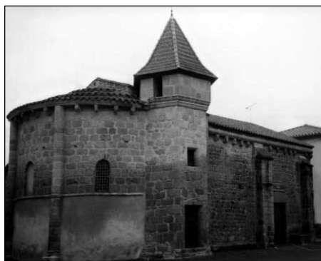
Photo 5 : La chapelle des Pénitents Blancs à Marsac-en-Livradois et sa mise en scène intérieure (ci-contre).