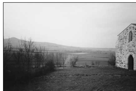
Photo 3 : La chapelle Sainte-Madeleine, isolée au cœur de la campagne.

pillages : colonnettes et chapiteaux arrachés, dalles enlevées, destruction du clocher et des couvertures. On a envisagé une première tentative de sauvegarde dès 1956, avec une proposition d'inscription à l'Inventaire des Monuments Historiques (non obtenue). Près de trente ans se sont écoulés avant la naissance de l'association des « Amis de Sainte-Madeleine » dont les objectifs visaient : la sauvegarde, la restauration, la protection et les toutes activités culturelles sur le site. La présidente, infatigable « quêteuse » de cotisations et de main-d'œuvre, ralliant à sa cause les maires des trois communes concernées, mais aussi le sous-préfet d'Issoire et de nombreux gradés de l'École militaire d'Issoire dont les élèves seront détachés au débroussaillage du terrain, très vite, s'est rendu compte des difficultés que rencontre une association dans sa quête de subventions. C'est ainsi qu'est né le SIVOM C-G-V en septembre 1985, non pas de l'action motivée des municipalités, mais sous l'impulsion de la très influente présidente de l'association.