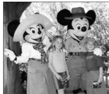
L'apparence du personnel, une question de crédibilité... et parfois de magie.

tactiques qui ciblent les sens des clients et qui ont comme objectif un service rendu si satisfaisant que seul un WOW ! pourra le décrire.