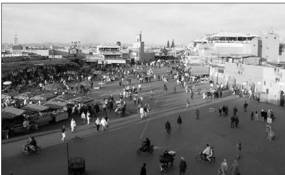
Place Jemaa El-Fna, Marrakech, Maroc.