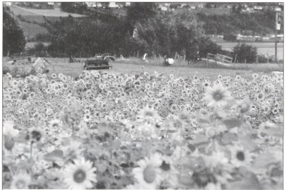
Champs de tournesols, Île d'Orléans.

Cette recherche identifie quatre catégories d'entreprises agricoles offrant des activités touristiques. Il n'existe aucun lien entre l'âge de la ferme et son appartenance à l'une de ces catégories. De plus, pour chacune des catégories, on constate que la majorité des activités touristiques est effectuée sur une base saisonnière. Ces activités touristiques se produisent généralement pendant le déroulement des activités agricoles.