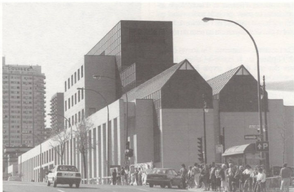
Musée d'art contemporain de Montréal (angle rue Sainte-Catherine et Jeanne-Mance).

Un effort particulier a également été fait cet été pour que le Musée soit présent dans toutes les publications touristiques, comme le guide touristique de Montréal et les publications distribuées dans les hôtels montréalais. La direction des communications et du marketing du Mu-