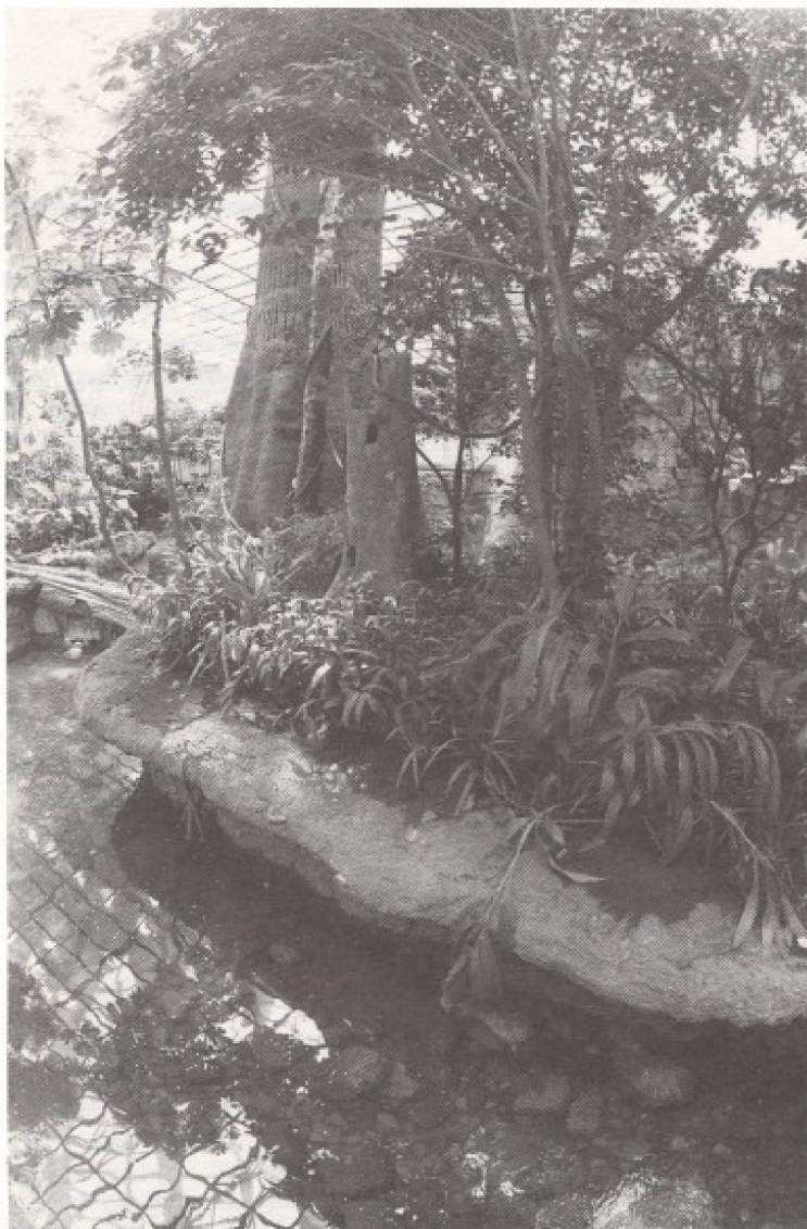
Biodôme de Montréal. La forêt tropicale, chaude et humide, illustre la diversité des espèces végétales du bassin amazonien.

objets qui mettent en relief diverses fonctions adaptatives des animaux et des végétaux.