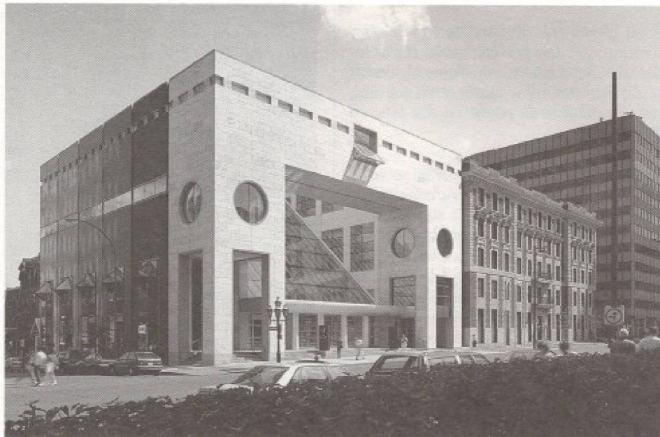
Musée des beaux-arts de Montréal : Vue de la façade du Musée Pavillon Jean-Noël Desmarais.

Certaines caractéristiques distinguent le Musée des Beaux-Arts de Montréal des autres musées d'ici et d'ailleurs: il dispose d'abord d'une collection encyclopédique d'oeuvres canadiennes, ce qui lui permet, par exemple, de faire une exposition comme celle qu'on trouve actuellement au Pavillon-nord pour les anniversaires (350 e et 125 e ), intitulée Nouveaux parcours d'art canadien (artistes montréalais qui ont marqué notre histoire de l'art: