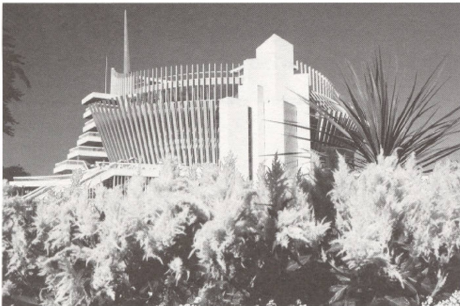
Le Palais de la Civilisation à l'île Notre-Dame (Pavillon de la France au temps de l'Expo 67).