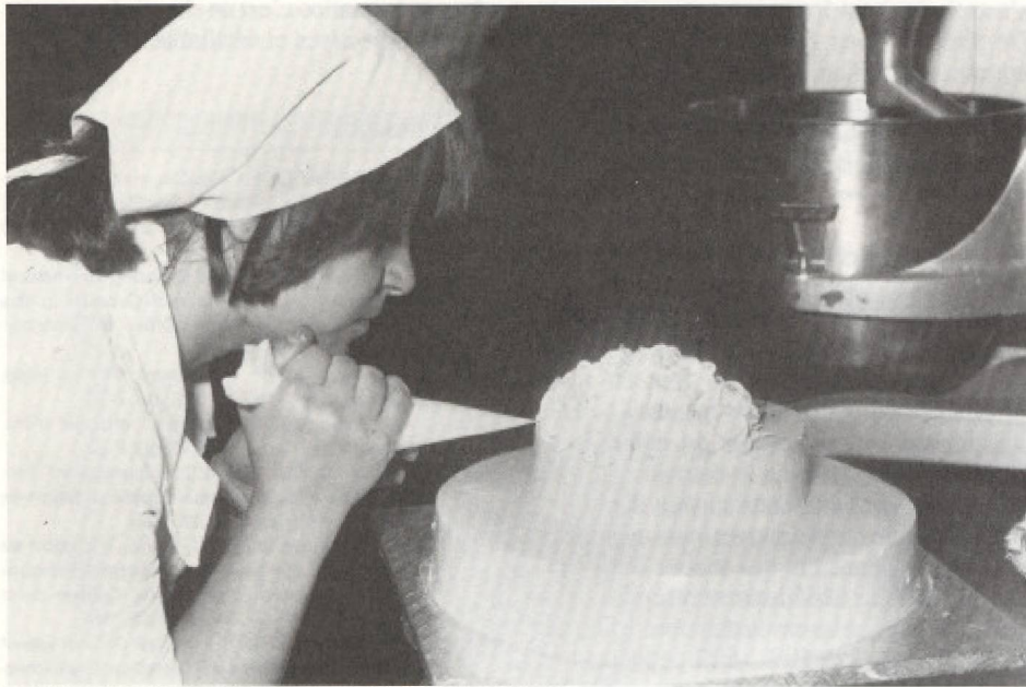
L'hôtellerie et la productivité: le rôle-clé des ressources humaines

L'incroyable maelström politique et économique qui a redistribué, depuis 1989, les cartes à l'échelle de la planète, bouleversant les marchés mondiaux, réduisant à merci certains secteurs et dynamisant d'autres, n'a pas épargné l'industrie touristique et ses composantes, indicateurs particulièrement sensibles aux moindres oscillations du compteur économique et social. L'industrie hôtelière a reçu de plein fouet le choc de la nouvelle donne économique et sociale.