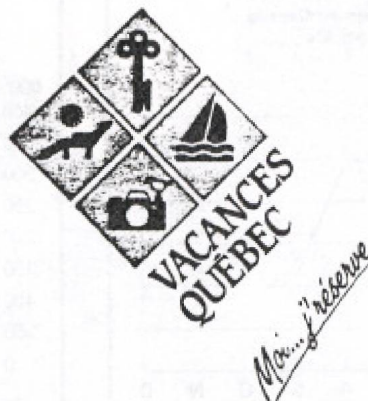
Le nouveau logo

Initié par l'Association technique du tourisme (ATT), le Salon Vacances Québec devient un outil de promotion privilégié du ministère du Tourisme dans son désir d'aider et d'encourager les Québécois à voyager au Québec.